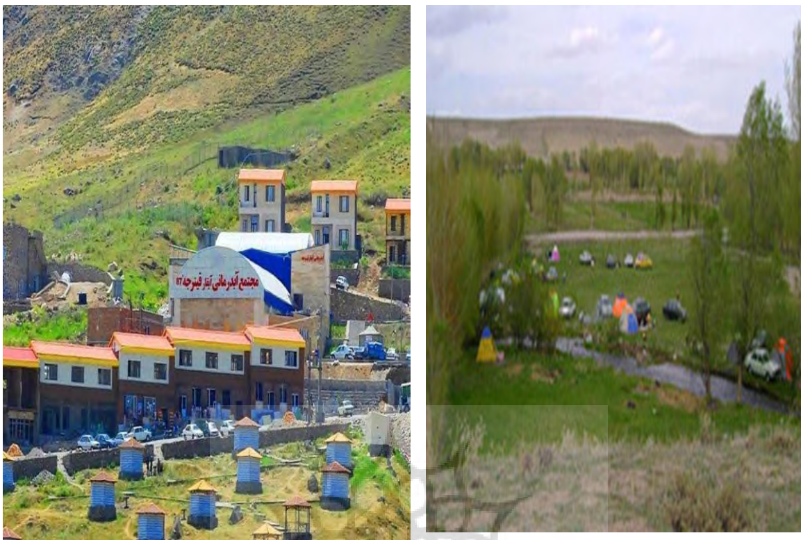
شکل ۲: نمایی از منطقه ژئوتوریستی نیر