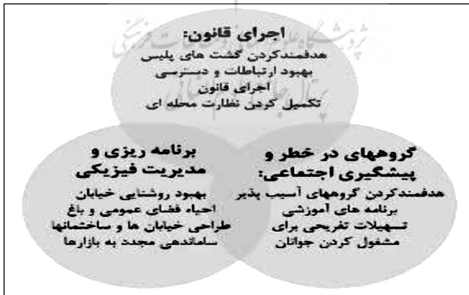
شکل ۲. سه رکن اصلی پیشگیری از جرم.

پت ترلا (۲۰۰۴)، سه رکن اساسی پیشگیری از جرم را در حوزه قانون، پیشگیری های اجتماعی و برنامه ریزی و طراحی های مناسب محیطی می داند که بدون توجه به آن نمی توان از جرائم قابل انتظار در محیط کاست.