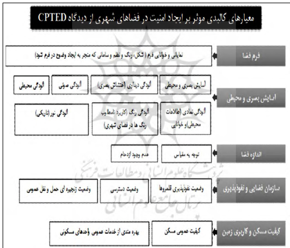
شکل ۱. معیارهای کالبدی مؤثر بر ایجاد امنیت در فضاهای شهری از دیدگاه رویکرد CPTED (Minnery et al., 2005)

جاکوب: جاکوب به مسئله امنیت و نیز عوامل بازدارنده فضایی و کالبدی اشاره نموده است: به نظر وی نشانه یک شهر موفق آن است که فرد در خیابان‌ها و کوچه‌ها و دیگر فضاهای شهر که مملو از غریبه است احساس امنیت و اطمینان کند و نباید خود به خود احساس کند که مورد تهدید است (حاتمی و ذاکر حقیقی، ۱۳۹۹).