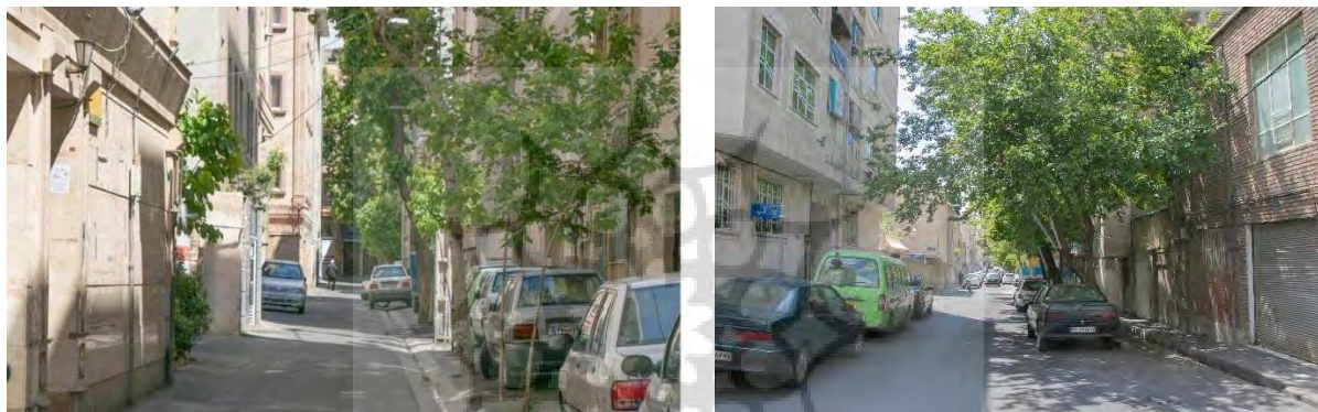
شکل ۲- تصاویری از محله بریانک (شهرداری منطقه ۱۴۰۱)