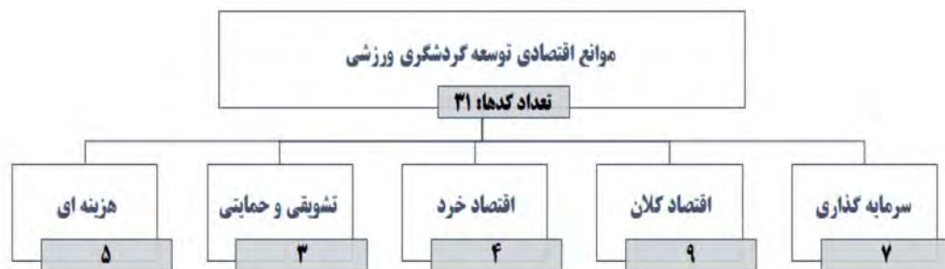
شکل ۱: مدل نهایی الگوی موانع اقتصادی توسعه گردشگری ورزشی ایران

در نهایت ۳۱ کد مفهومی و ۵ مقوله اصلی استخراج شد. (جلایری و همکاران، ۱۴۰۱). مدل نهایی الگوی موانع اقتصادی توسعه گردشگری ورزشی ایران در شکل ۱ نشان داده شده است.