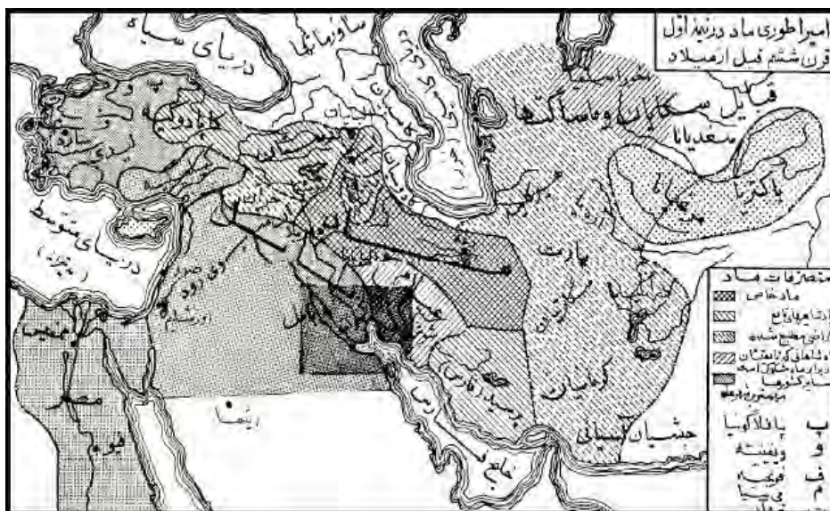
شکل ۱. قلمرو حکومت ماد و حکومت‌های همجوار