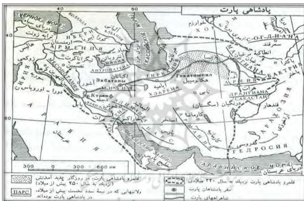
نقشه ۳. قلمرو جغرافیایی اشکانیان

تحت‌الحمایه پادشاه می‌شمردند و از این حیث به آن‌ها سرزمین‌های تابعه می‌گفتند. از حیث اختیار این سرزمین‌ها استقلال داشتند اما در عین حال به پادشاه مالیات پرداخت می‌کردند و در هنگام ضرورت، سپاه مجهز در اختیار پادشاه قرار می‌دادند. در این دوره پولیس‌ها (شهرها) نیز دارای ساختار ویژه‌ی خود بودند. در این دوره نیز، مانند دوره سلوکیان ساختار اداری پولیس‌ها مجزا از ساتراپ‌ها بوده است. بدین ترتیب که در رأس پولیس‌ها فردی به نام «استراتگ» قرار می‌گرفت که تحت نفوذ شاه بود و شهرها دارای خودمختاری بودند و به حکومت مرکزی مالیات پرداخت می‌کردند. در ارتباط با ساختار مالی در دوران اشکانیان نیز در هر ساتراپی دستگاه اقتصادی شاهی وجود داشته است. امور مالی و اقتصادی سلطنتی را در این دوره در هر ساتراپی کارمندی که «استاندار» نامیده می‌شد اداره می‌کرده است. برای محاسبه دقیق وصول مالیات و خراج، وصولی‌ها در اداراتی که در عین حال جنبه دفترخانه داشتند ثبت می‌شد، این وظیفه را در شهرها «خرماتیسترا» انجام می‌داد و در دهکده‌ها که کوچک‌ترین واحد اداری و اراضی ساتراپ نشین بودند «کارمندان» مربوط به استاتم‌ها امور مالی را انجام می‌دادند!