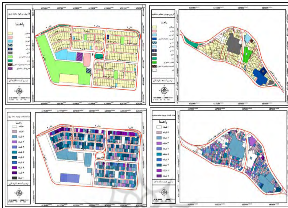
شکل ۲. نقشه‌های وضع موجود کاربری اراضی و تعداد طبقات محلات مورد مطالعه