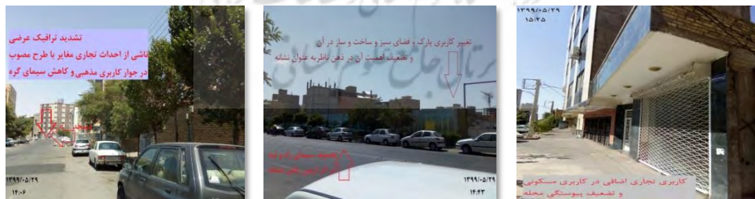
شکل ۶. عکس نمونه‌ای از تأثیر منفی تخلفات در تغییر کاربری اراضی بر سیمای شهری محله دمشقیه