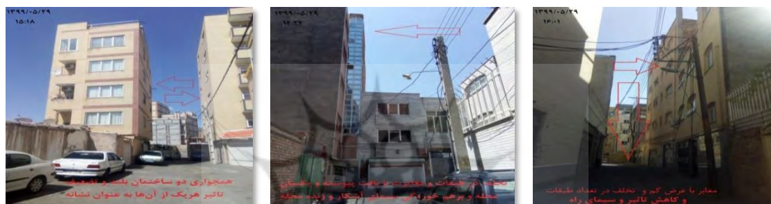
شکل ۸. عکس نمونه‌ای از تأثیر منفی تخلفات در تعداد طبقات بر سیمای شهری محله دمشقیه