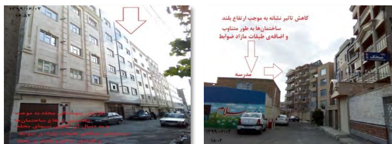
شکل ۷. عکس نمونه‌ای از تأثیر منفی تخلفات در تعداد طبقات بر سیمای شهری محله پرواز