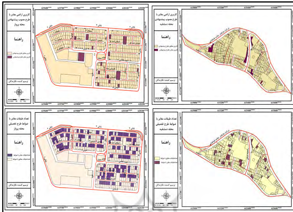
شکل ۴. نقشه‌های تخلفات در کاربری اراضی و تعداد طبقات محلات مورد مطالعه