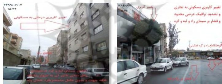
شکل ۵. عکس نمونه‌ای از تأثیر منفی تخلفات در تغییر کاربری اراضی بر سیمای شهری محله پرواز