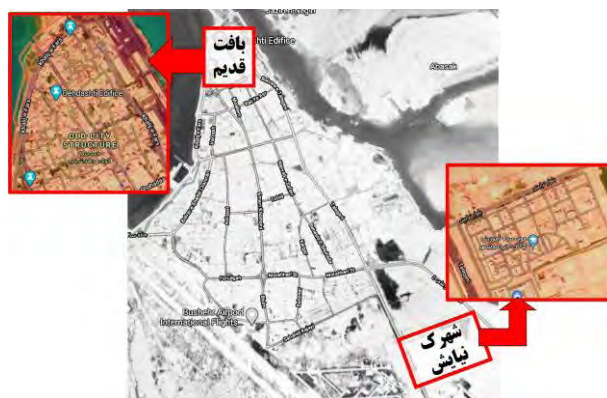
شکل ۱. موقعیت بافت قدیم و شهرک نیایش در شهر بوشهر