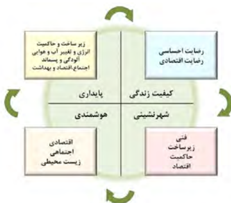
شکل ۱. ویژگی شهرهای هوشمند، منبع: (Bhagya & Silva, 2018:698)

توسعه محلات شهر هوشمند به شاخص‌هایی نیاز دارد. این شاخص‌ها، معیاری مناسب برای ارزیابی تأثیر ارتباطات در هوشمند سازی شهرهاست. با بررسی تجارب و مبانی نظری مرتبط با موضوع پژوهش، شاخص‌های شهر هوشمند در ابعاد مختلف شهر هوشمند اعم از: اقتصاد هوشمند، محیط هوشمند، زندگی هوشمند، پویایی هوشمند، حکمرانی هوشمند و حمل‌ونقل هوشمند استخراج شد که در جدول ۲ به صورت خلاصه به آن می‌پردازیم.