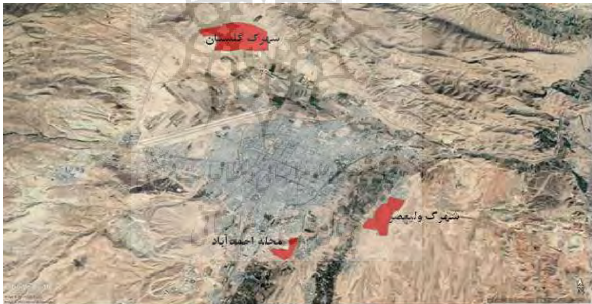
شکل ۲: موقعیت محلات مورد بررسی در شهر بجنورد