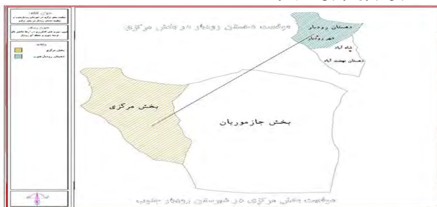
شکل ۱- نقشه موقعیت بخش مرکزی در شهرستان رودبار جنوب

شهرستان رودبار جنوب با وسعت حدود ۶۸۶۴ کیلومتر مربع معادل ۳/۷ درصد مساحت استان را به خود اختصاص داده است. طبق آخرین آمار و اطلاعات ارائه شده از جمعیت شهرستان در سال ۱۳۹۵ معادل ۱۰۵۹۹۱ می‌باشد که از این میزان ۲۱۵۸۲ نفر جمعیت شهری و ۸۴۴۱۰ نفر را جمعیت روستایی تشکیل می‌دهد. این شهرستان دارای دو بخش که شامل ۲ شهر و ۲۹۱ آبادی دارای سکنه است. در بخش مرکزی یک شهر و دو دهستان با ۱۰۴ آبادی دارای سکنه و مجموع ۱۳۱ آبادی واقع شده است. شهر رودبار مرکز شهرستان رودبار و واقع در بخش مرکزی شهرستان می‌باشد. این شهر با مختصات ۵۷°۵۷ طول شرقی و ۲۸°۱۰ عرض شمالی و با ارتفاع ۴۷۵ متر از سطح دریاها آزاد، از موقعیت طبیعی دشتی برخوردار است. شهر رودبار دارای آب و هوای گرم و خشک است که تا حدودی متاثر از دشت لوت می‌باشد. شهر رودبار از نظر موقعیت طبیعی دشتی است و در پیرامون آن ارتفاع مهمی به چشم نمی‌خورد. نزدیک‌ترین ارتفاعات به شهر عبارتند از: کوه سرخ گزی با ارتفاع ۷۱۸ متر در فاصله ۱۵ کیلومتری شمال غرب رودبار و کوه ایسگو با ارتفاع ۷۳۹ متر در فاصله ۲۴ کیلومتری شمال غربی شهر قرار گرفته‌اند.