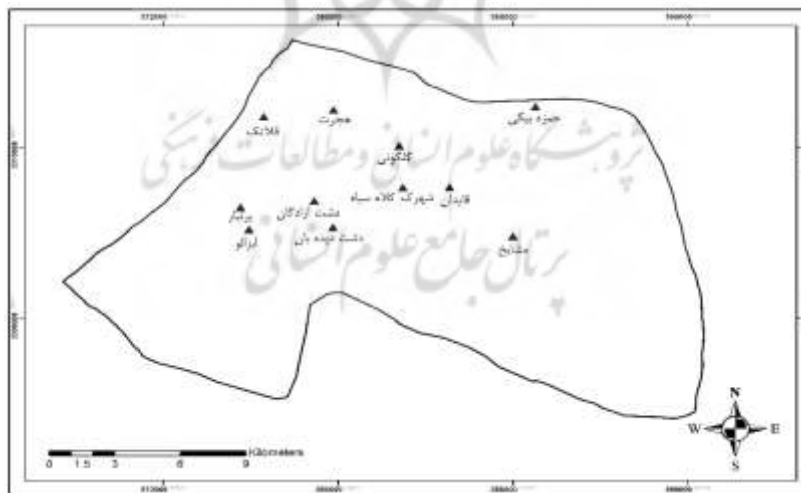
شکل ۲. موقعیت روستاهای نمونه تحقیق