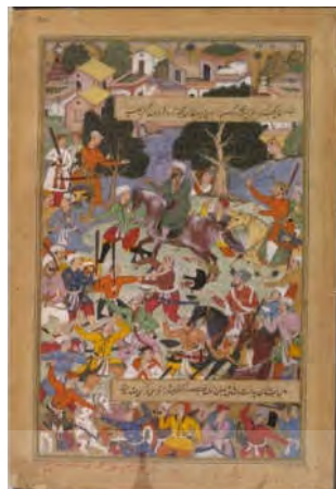
شکل ۶ منیم خان، اکبرنامه، موزه ویکتوریا و آلبرت، ۱۵۹۵-۱۵۹۰

منبع: ( https://collections.vam.ac.uk/item/O9733/munim-khan-painting-jagan/ )