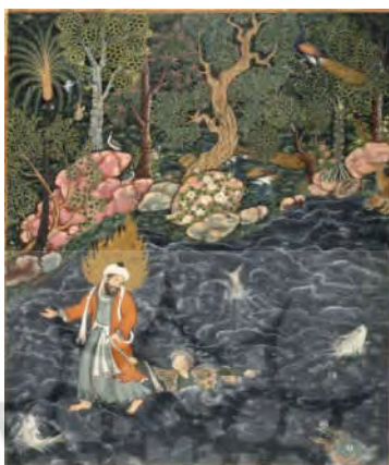
شکل ۳. نجات شاهزاده نورالدهر از رودخانه توسط الیاس نبی، میرسید علی، موزه بریتانیا، ۱۵۶۴.

است نه عبادت؛ همانند تقدس نور در باور شیخ شهاب الدین سهرودی؛ اما آتش در میان آریایی‌ها پیش از پیدایش دین زرتشت، به عنوان خدای ویژه عبادت می‌شده است (معین، ۱۳۹۴، ص. ۲۸۶). با توجه به بررسی‌های صورت گرفته شکی نیست که چنین هاله‌های آتشین تحت تأثیر اندیشه‌ی ایرانی در نگارگری دوره اکبرشاه نقش شده است.