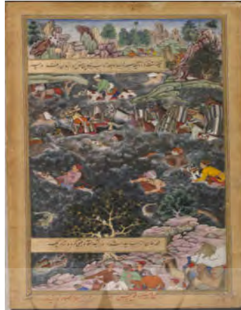
شکل ۲. پیرمحمدخان هنگام عبور از رودخانه غرق می شود، اکبرنامه، موزه ویکتوریا و آلبرت، ۱۵۶۲

از دیگر تأثیرات نقاشی ایران بر نقاشی این دوره وجود عناصری چون کلاه، دستار، شال و استفاده از هاله ی آتشین است (تصویر ۳). لازم به ذکر است که هاله ی آتشین با دیدگاه ایرانیان و زرتشتیان هند (پارسیان) ارتباط نزدیکی دارد. آتش همواره مرکز مناسک و آیین های ایرانیان (پیش از اسلام) و هندوها بوده است. با توجه به تبار مشترک ایرانیان و هندیها و همسانی اسطوره های این دو قوم میتوان گفت: آتش در متون ودایی ۹ و اوستایی به گونه ای در پیوند با یکدیگر هستند (هینلز، ۱۴۰۰، ص. ۴۷). در فرهنگ هندو آتش همواره با نام آگنی ۱۰ ستایش میشود و هنگامی که پیروان این دین هدیه های خود را بر او نثار میکنند، بر این باور هستند که آگنی میاندار بین انسان و خدایان است؛ او خدایی است که قربانی را دریافت و آن را به خدایان تقدیم میکند. در برخی از منابع آگنی را فرزند برهمن ذکر کرده اند. در متون اوستایی «آتر» از ایزدان به شمار میآید و پسر اهورا مزدا نامیده میشود (معین، ۱۳۹۴، ص. ۲۷۶). در متون اوستایی و در باور مزدیسنايي، تقدس آتش به عنوان نیایش