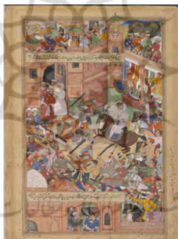
شکل ۵. نبرد برای نجات اکبر در دهلی، اکبرنامه، موزه ویکتوریا و آلبرت، ۱۵۹۰