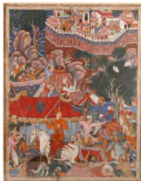
شکل ۱. حمله اسد بن کبیر به اردوگاه ملک ایرج، حمزه نامه، موزه متروپولیتن، ۱۵۶۴

صورت تصویر است و در جهت نیل به این هدف از کلیه عناصر دیداری و محتوایی در جهت رسیدن به هدف خود به بهترین شکل بهره میگیرد.