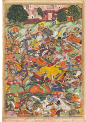
شکل ۸. شکست نمو در نبرد بانیهات، اکبرنامه، گالری ملی ویکتوریا، ۱۵۹۰.