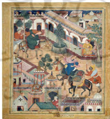
شکل ۱۱. جاسوس زانبور را به شهر می‌آورد، حمزه نامه، موزه متروپولیتن، ۱۵۷۰.

منظره پردازی نیز در این آثار با ترکیببندی در نمایش ناقص ژرف‌نمایی بناها و طبیعت و همچنین پردازش چهره‌ها و حیوانات در جهت نوعی حجم پردازی اروپایی، سبب تعلیق بین فضای دوبعدی و سه بعدی شده است (تصویر ۱۱).