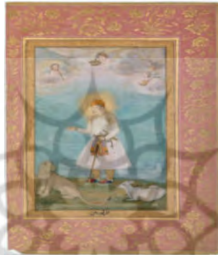
شکل ۱۲. اکبر در کنار شیر و بره، ۱۶۳۰، موزه متروپولیتن

شرایطی سبب شد تا شیوه ی تمثیلی نقاشی این دوره از گراورهای اروپایی و حاشیه ی انجیل های چاپی اهدایی تأثیر بپذیرد (ورونویت و خلیلی ۱۳۸۳، ص ص. ۲۰۱-۲۰۴). ابا کوخ در این خصوص میگوید: «با توجه به پیشینه ی تمثیلی موجود در نقاشی هند (که در این مقاله نیز به آن اشاره شد)، بهره گیری از نمادهای اروپایی- مسیحی از جمله تمثیل شیر و بره که نشان از صلح و آرامش در جوار پادشاه توانمند است، به صورت بارز قابل مشاهده است. او این آرامش را که نتیجه ی امنیت و صلح دوران پادشاهی اکبرشاه دانسته و با قسمتی از انجیل که از آرامش میان شیر، گاو و بره و گرگ که در کنار هم صحبت میکنند مقایسه میکند» (Koch, 2001, 45)(شکل ۱۲)