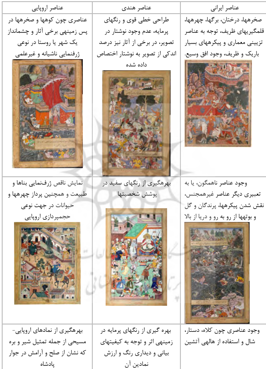
جدول ۱. بررسی عناصر ایرانی، هندی و اروپایی در نگاره‌ها