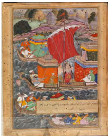
شکل ۱۰. مادر اکبر با قایق به آگرا می‌رود، اکبرنامه، موزه ویکتوریا و آلبرت، ۱۵۹۰. منبع: https://collections.vam.ac.uk/item/O9283/akbars-mother-travels-by-boat-painting-tulsi/mariam-makani-painting-tulsi/

منظره پردازی نیز در این آثار با ترکیببندی در نمایش ناقص ژرف‌نمایی بناها و طبیعت و همچنین پردازش چهره‌ها و حیوانات در جهت نوعی حجم پردازی اروپایی، سبب تعلیق بین فضای دوبعدی و سه بعدی شده است (تصویر ۱۱).