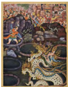
شکل ۹. عمر اژدها را شکست میدهد، حمزه نامه، موزه هنرهای کاربردی وین، ۱۵۲۶.