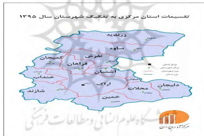
تصویر ۱- نقشه استان مرکزی و تقسیمات شهرستان‌ها

۶. آیا این گونه به گروه زبانی بزرگتری تعلق دارد؟