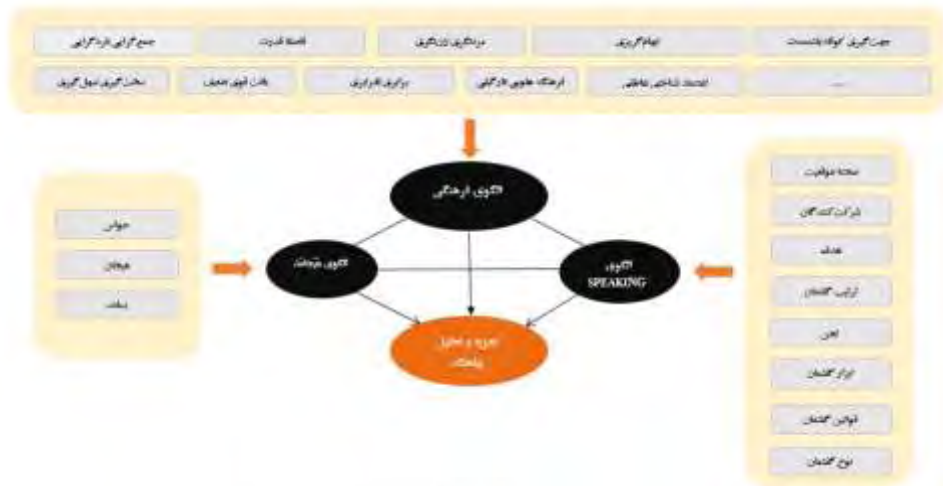
شکل ۱. الگوی مفهومی تحلیل زیاهنگ (پیش‌قدم، ابراهیمی و درخشان، ۲۰۲۰، ص. ۳۱)