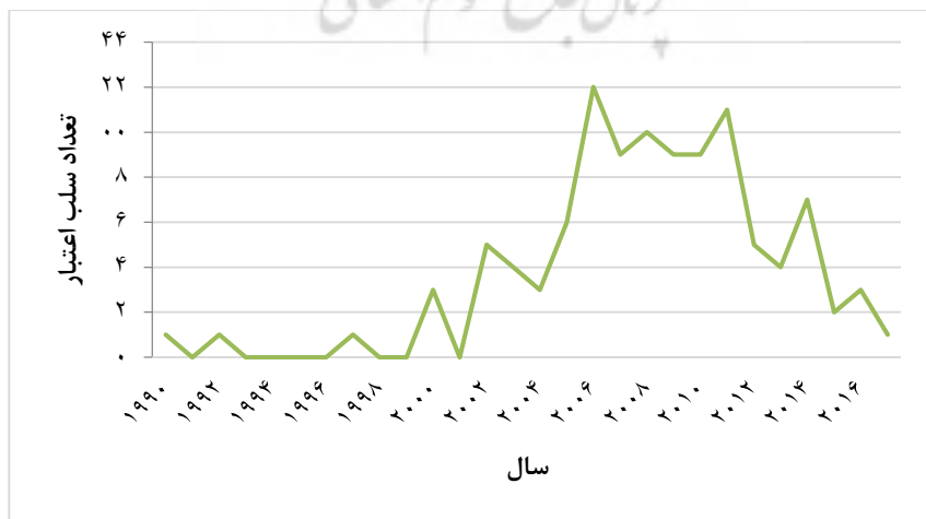
نمودار ۱. فراوانی مقاله‌های سلب اعتبار شده حوزه غدد درون‌ریز و متابولیسم طی سال‌های ۱۹۹۰ تا ۲۰۱۷

عدد درون‌ریز و متابولیسم را طی دوره مورد بررسی نشان می‌دهد. همان‌گونه که در نمودار مشخص است، بیشترین تعداد مقاله‌های سلب اعتبار شده مربوط به سال‌های ۲۰۰۶ و ۲۰۱۱ به ترتیب با ۱۲ و ۱۱ مقاله بوده است. در فاصله سال‌های ۱۹۹۰ تا سال ۱۹۹۹، در هر سال حداکثر یک مقاله سلب اعتبار شده در این حوزه وجود داشته و از سال ۲۰۰۰ به بعد، رخداد مقاله‌های سلب اعتبار شده بیشتر نیز بوده است (نمودار یک).