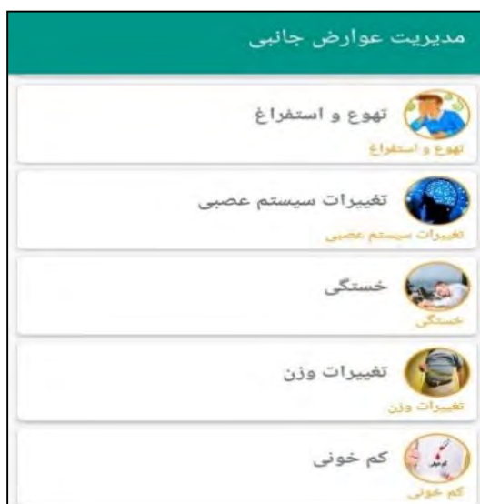
شکل ۳: مدیریت عوارض جانبی برنامه کاربردی خود مراقبتی بیماران مبتلا به سرطان پستان تحت شیمی درمانی