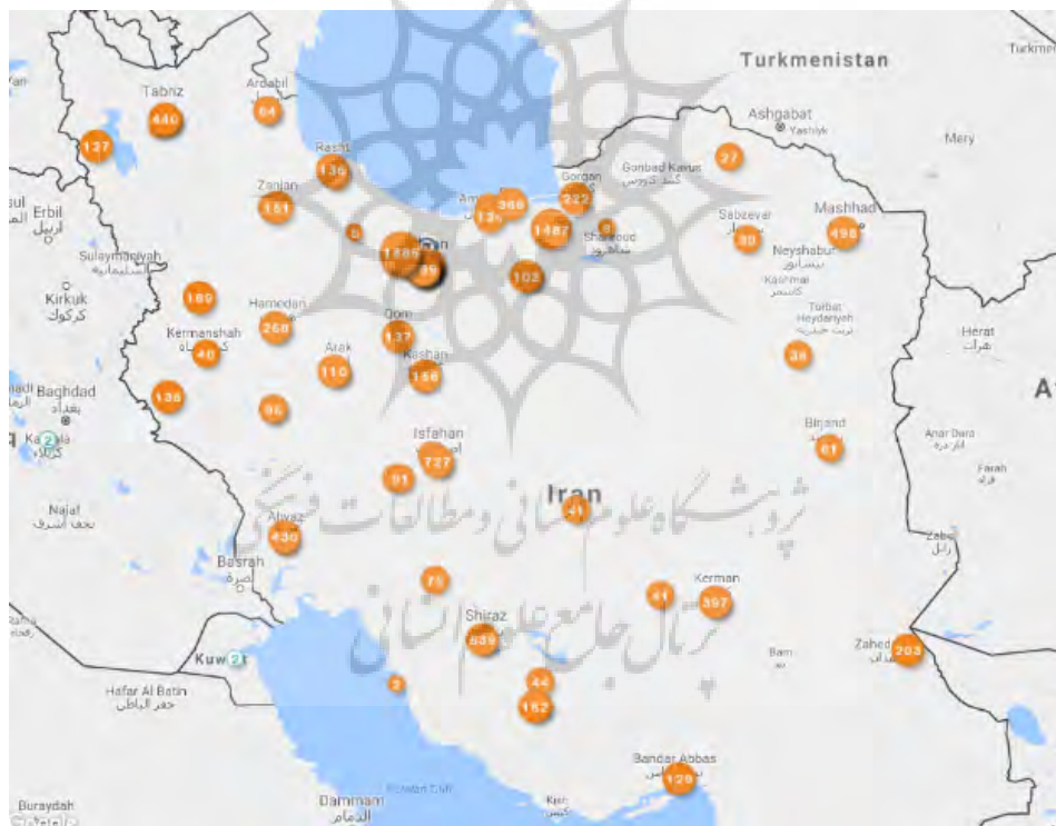
تصویر ۵: نقشه همکاری‌های علمی دانشگاه علوم پزشکی تهران با سایر دانشگاه‌های کشور

طی سال‌های ۲۰۱۱ تا ۲۰۱۵ میلادی است. در خصوص سایر کشورهای منطقه خاورمیانه، بیشترین میزان همکاری‌ها با کشورهای ترکیه (۶۴ مقاله مشارکتی با ۳۶ موسسه)، عربستان سعودی (۴۷ مقاله مشارکتی با ۸ موسسه) و لبنان (۳۱ مقاله مشارکتی با ۵ موسسه) انجام گرفته است. اگرچه کشور ترکیه با انتشار ۸۲۴۳۶ مقاله در حوزه علوم پزشکی طی سال‌های ۲۰۱۱ تا ۲۰۱۵، پنج پله بالاتر از ایران در جایگاه ۱۵ پرتولیدترین کشورهای جهان قرار دارد، اما بررسی دو شاخص میانگین استنادهای دریافتی (۳/۳ ترکیه و ۳/۸ ایران) و شاخص تأثیرگذاری استنادی وزن دهی شده در سطح رشته (۰/۶۱ ترکیه و ۰/۷۳ ایران) حکایت از کیفیت بالاتر تولیدات علمی ایران در مقایسه با رقیب منطقه‌ای خود دارد. در سوی مقابل،