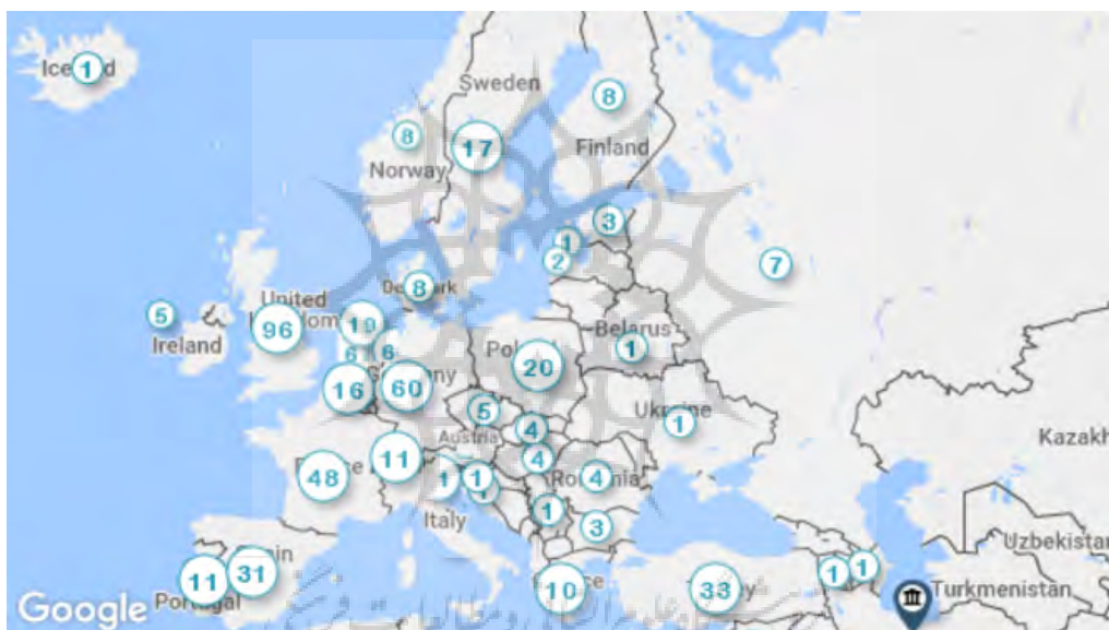
تصویر ۳: نقشه کشورهای اروپایی همکار با دانشگاه علوم پزشکی تهران

دارند، اما مقالات حاصل از همکاری با کالج سلطنتی لندن به میزان ۵/۷ برابر بیشتر از مقالات مشارکتی با دانشگاه بازل استناد دریافت کرده‌اند (متوسط ۱۵۷/۸ استناد در مقابل ۲۷/۴ استناد). یکی از یافته‌های قابل توجه پژوهش، افزایش همکاری‌های علمی دانشگاه علوم پزشکی تهران با کالج سلطنتی لندن از چهار مورد در سال ۲۰۱۱ به ۱۴ مورد در سال ۲۰۱۵ میلادی است. از نتایج قابل توجه دیگر می‌توان به همکاری دانشگاه علوم پزشکی تهران با دانشگاه بریستول (University of Bristol) کشور انگلستان در تألیف ۱۴ مقاله مشترک اشاره نمود که این مقالات با دریافت ۸۹۸۴