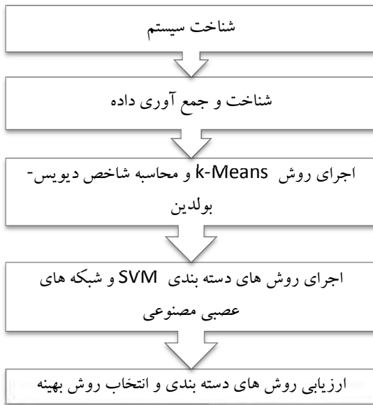
شکل ۱: مراحل اجرای تحقیق حاضر