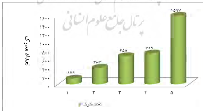
نمودار ۱: الگوی هم‌تألفی انتشارات پژوهشگران ایران در حوزه داروشناسی و داروسازی در پایگاه وب آو ساینس در طول سال های ۲۰۰۰-۲۰۱۲

بررسی شبکه هم‌تألفی در مدارک مورد بررسی در این پژوهش نشان داد که از کل ۳۵۱۴ مدرک مورد مطالعه، ۱۳۱ مدرک تک نویسنده‌ای، ۳۸۲ مدرک دو نویسنده‌ای، ۶۸۵ مدرک سه نویسنده‌ای و ۷۱۹ مدرک الگوی چهار نویسنده ای دارند و ۱۵۹۷ مدرک نیز هر کدام با مشارکت پنج و یا بیش از پنج نویسنده نوشته شده‌اند. نمودار (۱) الگوی هم‌تألفی را در این انتشارات منعکس نموده است. این نمودار، الگوی نویسندگی و تعداد مدارک در هر یک از الگوهای نویسندگی را نشان می‌دهد. همان‌گونه که این نمودار نشان می‌دهد، تنها ۳۱ مدرک، الگوی تک نویسنده ای دارند و در حدود نیمی از انتشارات توسط پنج و یا بیش از پنج نویسنده نوشته شده است، که الگوی غالب است.