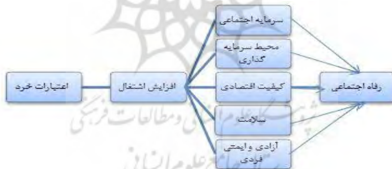
نمودار ۱: مدل مفهومی تحقیق

آزادی شخصی، میزان آزادی که جمعیت یک کشور در تعیین مسیر زندگی خود بدون محدودیت‌های بی‌مورد را در نظر می‌گیرد، تعیین می‌کند. این محدودیت شامل آزادی از زور و محدودیت در حرکت، سخنرانی و اجتماع است. در این موضوع سطح مأموریتی که فرد تجربه می‌کند و آزادی وی از تبعیض، اساسی است. همچنین یک محیط امن و پایدار برای جذب سرمایه‌گذاری و پایداری رشد اقتصادی ضروری است. به طور خلاصه، یک ملت می‌تواند فقط در یک محیط با آزادی فردی و امنیت برای شهروندان خود، پیشرفت کند. شاخص آزادی و ایمنی فردی از پنج عنصر آزادی بیان و دسترسی به اطلاعات، عدم وجود تبعیض قانونی، سه نظر: اجتماعی، جرم خشونت‌آمیز و جرم مالکیت ساخته شده است؛ همان‌طور که در قسمتی از تعریف آمده است محیط امن به جذب مناسب سرمایه‌گذاری و پایداری در رشد اقتصادی کمک می‌کند که رفاه اجتماعی به تبع رشد اقتصادی ارتقا می‌یابد (شاخص رفاه اجتماعی لگاتوم، ۲۰۲۰). در مجموع، اعتبارات خرد منجر به اشتغال در مناطق روستایی می‌شود و این اشتغال از طریق شاخص‌های رفاه اجتماعی به بهبود رفاه اجتماعی منجر می‌شود. مدل مفهومی تأثیر اعتبارات خرد بر رفاه اجتماعی در نمودار ۱ آورده شده است.