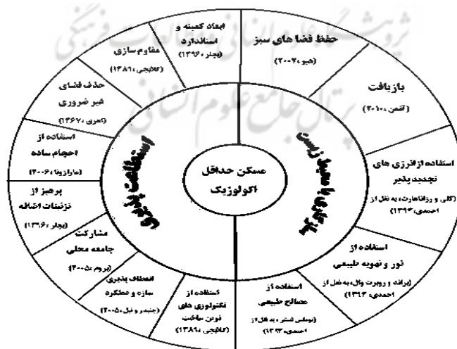
ت ۱. شاخص‌های نظری پژوهش