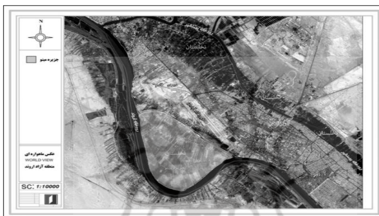
ت۳. تصویر ماهواره‌ای از جزیره مینو

این جزیره قبل از جنگ ایران و عراق، جزیره آبادی بوده است؛ اما به واسطه جنگ، بسیاری از خانه‌های این جزیره ویران شدند و نخلستان‌های آن از بین رفته‌اند. جنگ و شوری آب و خاک و از بین رفتن نخلستان‌ها موجب شده‌اند که شهرهای آبادان و خرمشهر و جزیره مینو از رونق بیفتند و بیکاری و مشکلات اقتصادی برای جزیره مینو که اقتصادش بر پایه کشاورزی و ماهیگیری بود، به معضل بزرگی مبدل گردد. پس از جنگ، دولت با هدف محرومیت‌زدایی و به‌عنوان