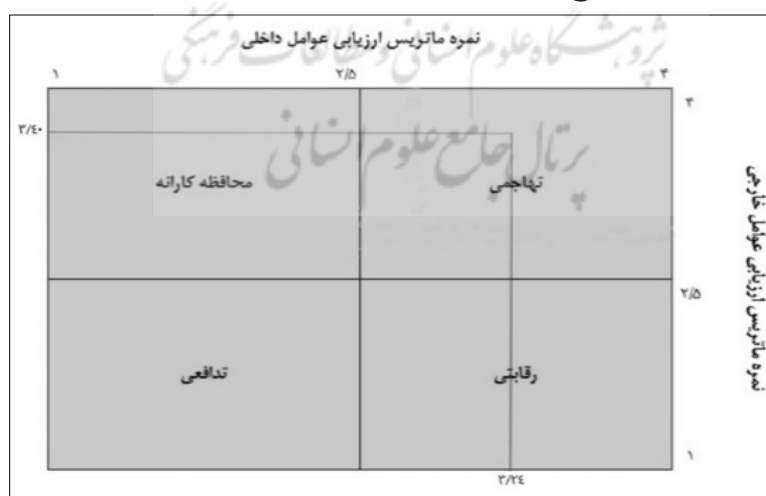
ت ۴. تجزیه و تحلیل ماتریس داخلی و خارجی

گام سوم: (تجزیه و تحلیل ماتریس داخلی و خارجی) از ماتریس ارزیابی عوامل داخلی و خارجی بیانگر آن‌اند که وضعیت در حالت تهاجمی قرار دارد و این وضعیت ناشی از غلبه نقاط قوت داخلی بر نقاط ضعف داخلی و فرصت‌های محیطی بر تهدیدهاست. بنابراین، استراتژی‌های مناسب باید با استفاده از نقاط قوت داخلی به بهره‌برداری از فرصت‌های محیطی بپردازد. همان‌طور که از شکل شماره ۴ پیداست، شرایط برای استفاده از استراتژی‌های تهاجمی آماده است. برای تعیین موقعیت باید نمرات حاصل از ماتریس ارزیابی عوامل داخلی و ماتریس ارزیابی عوامل خارجی را در ابعاد عمودی و افقی آن قرار داد تا جایگاه مشخص گردد و بتوان استراتژی مناسبی را برای آن مشخص کرد. این ماتریس که منطبق بر ماتریس SWOT است و استراتژی مناسب را مشخص می‌کند، در تصویر شماره ۴ ارائه شده است. نتایج به‌دست‌آمده