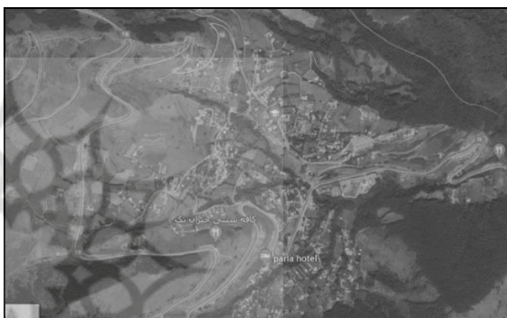
ت ۲. تصاویری از وضع موجود خانه‌های دوم در روستای حیران.