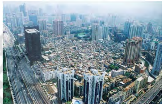
ت 4. منظر چنگزونگان، گوانگژو. (TIAN, 2008).

زندگی برای روستاییان محلی به حساب می آیند و درآمد و اشتغال ایجاد شده در آن ها برای بقای جمعیت روستای سنتی ضروری است. در درجه دوم، آن ها میلیون ها نفر از کارگران مهاجر یا همان نیروهای کار به وجود آمده در روند شهرنشینی را به محل اقامت های ارزان دعوت می کنند (Wang et al., 2009). به واسطه حضور این جمعیت شناور (Changqing et al., 2007) روستا- شهرها اجتماعی پیچیده دارند و با مشکلاتی از قبیل بالا رفتن جرم و جنایت، اعتیاد به مواد مخدر، اعتیاد به الکل، و فحشا روبه رو هستند (Ji & Yang, 2008).