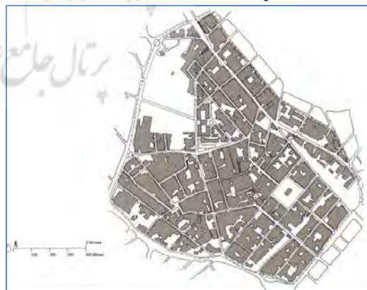
ت 1. سایت صنعتی The Jewellery Quarter در بریتانیا. (Neal, 2003).

از نظر شاخص‌های محیط‌زیستی، این‌گونه روستا-شهرها عمدتاً در مناطق شهری و به‌طور کلی در داخل شهرها واقع شده‌اند (Landman, 2003) و در جریان شهرگریزی و بازگشت به محیط‌زیست روستا به‌وجود می‌آیند. مفهوم روستا-شهر در ابتدا تا حد زیادی به‌عنوان استفاده از فضاهای سبز تفسیر می‌شد اما با گذشت زمان، این مفهوم مترادف مناسبی برای برنامه‌های جدید در پایداری و زندگی شهری بوده است. روستا-شهرها همچنین برای اراضی متروکه داخل شهر 16 و فضای آماده ساخت محصور بین فضای‌های ساخته‌شده 17 مناسب بوده و انتخاب دقیقی برای اراضی اختصاص یافته به فضای سبز 18 به‌نظر می‌رسند (Franklin & Tait, 2002) (Michael Biddulph, Franklin, & Tait, 2003). آن‌ها اغلب در طیف وسیعی از فضاهای داخل شهر که قبلاً کاربری خاصی داشته ولی اکنون کاربری سابق را ندارند، مانند راه‌آهن قدیمی، سایت‌های سابق صنعتی (تصویر شماره 1) و مناطق مسکونی قدیمی، برنامه‌ریزی و ساخته می‌شوند (Landman, 2003) (Michael Biddulph et al., 2003).