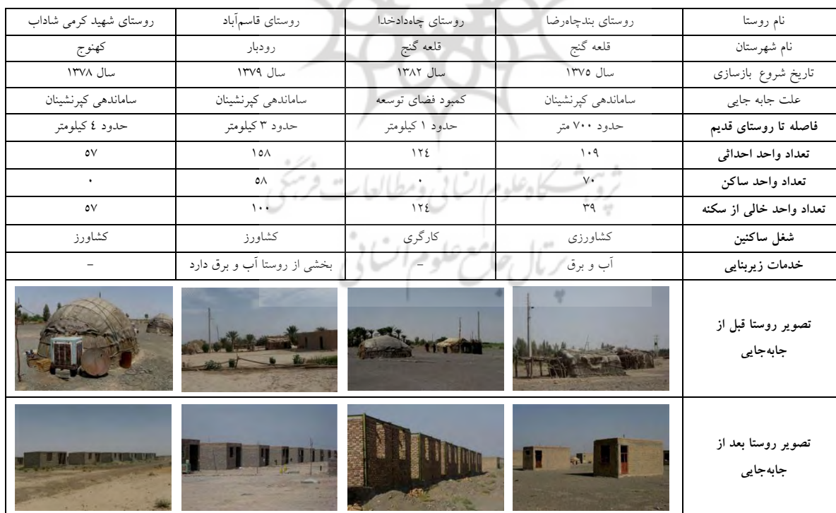
ج ۲. معرفی روستاهای مورد مطالعه ۱۷

چگونگی توزیع حجم نمونه در روستاهای مورد مطالعه در "جدول ۳" ارائه شده است. در ذیل به ارائه توزیع فراوانی یکی از سؤالات پژوهش در گروه‌های مورد مطالعه می‌پردازیم "جدول ۴".