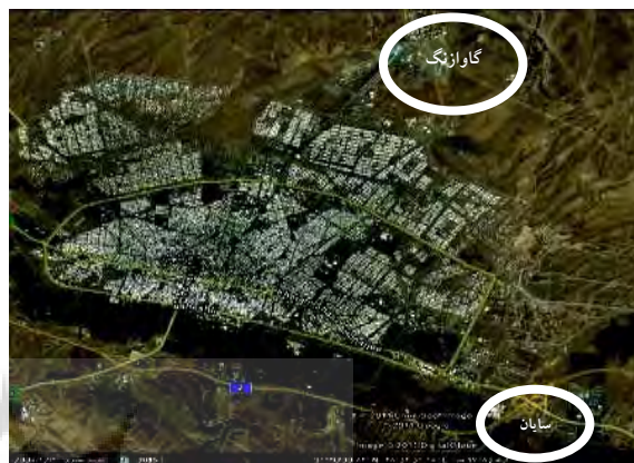
ت ۴. تصویر ماهواره‌ای شهر زنجان در سال ۱۳۹۰ و موقعیت روستاهای گاوازنگ و سایان در آن.

معابر) کمتر از ۳ هکتار و جمعیت کنونی روستا در سال ۱۳۹۰ برابر با ۴۱۷ نفر بوده است (مرکز بهداشت شهرستان زنجان، ۱۳۹۰). از نظر موقعیت قرارگیری، از شمال و غرب به ارتفاعات زنجان شمالی، از شرق به روستای پایین کوه و از جنوب با شهر زنجان مجاور است (ت ۴).