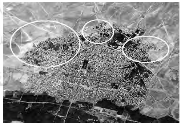
ت ۱. محدوده و هسته‌های نخستین گسترش کالبدی شهر زنجان در ۱۳۳۵.

مرحله ششم: این مرحله، گسترش و توسعه کالبدی شهر از ۱۳۴۵ تا ۱۳۵۷ را شامل می‌شود. در این دوره شهر زنجان نیز از پیامدهای اصلاحات ارضی سال ۱۳۴۱ به دور نماند و تحت تأثیر جریانهای مهاجرتی این دوره، تحولات کالبدی چشمگیری در شهر اتفاق افتاد که اوج این روند تحولی به سالهای آغازین دهه ۱۳۵۰ باز می‌گردد. در این دوره به سبب مهاجرت‌های روستایی- شهری، عرصه‌های حاشیه نشین زورآباد (بی‌سیم) در شمال شرقی و صفراآباد (اسلام آباد) در شمال غربی شهر پدیدار شد.