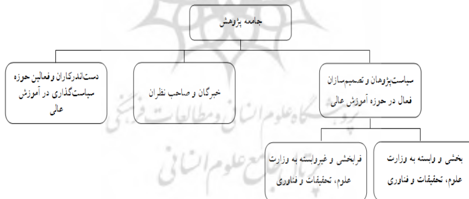
شکل ۲. جامعه آماری پژوهش در بخش کمی

در بخش کیفی پژوهش حاضر، نمونه‌گیری هدفمند ۳ تا رسیدن مقوله‌ها به اشباع نظری ۴ ، که در آن داده‌های جدیدی در ارتباط با مقوله پدید نمی‌آید، مقوله‌ها گستره مناسبی می‌یابند و روابط بین مقوله‌ها برقرار و تایید می‌شود (Corbin & Stauss, 2008, 148)، ادامه یافت. در پژوهش حاضر پس از انجام ۱۵ مصاحبه (زمان مصاحبه‌های انجام گرفته بین ۱۱۰-۴۵ دقیقه بوده است) داده‌ها به میزانی از تکرار رسیدند، که پژوهشگر را مجاب به پایان فرایند مصاحبه نمود. جامعه آماری پژوهش حاضر (در بخش کمی پژوهش) به شرح شکل شماره ۲ می‌باشد.