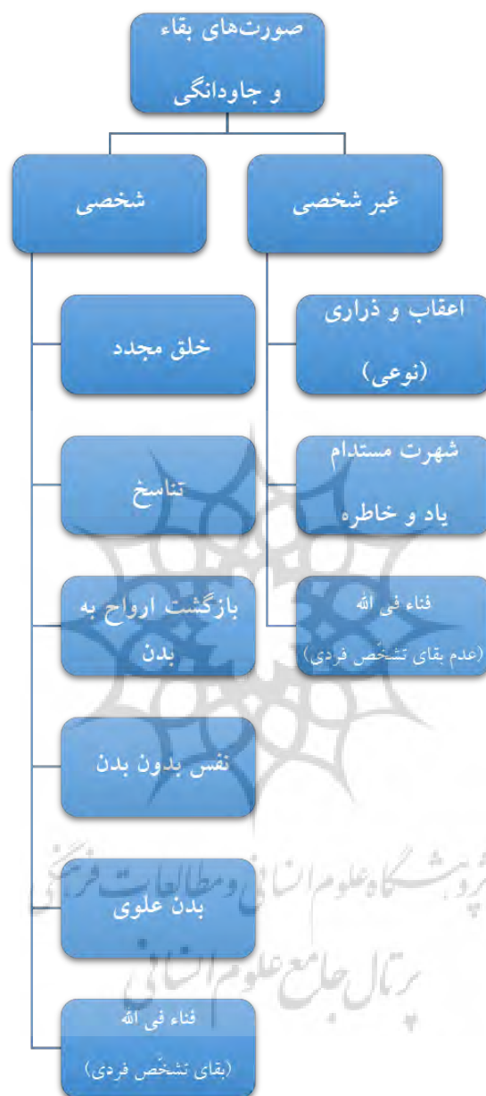
نمودار شماره ۳ صور بقاء و جاودانگی