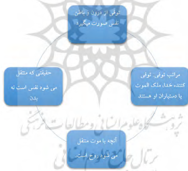
نمودار شماره ۲ حقیقت توفی

روح او می‌داند. به تعبیر علامه، این آیه از روشن‌ترین آیات قرآنی است که دلالت بر تجرد نفس کرده و می‌فهماند که نفس جزو بدن و حالی از حالات آن نیست، بلکه غیر از بدن است. کلمه «توفی» از ماده «وفی» به معنای گرفتن چیزی به‌طور تمام است و با توجه به اینکه آیه دربردارنده معانی اخذ، امساک و ارسال نسبت به نفس است، این آیه دلالت دارد بر اینکه نفس و بدن با یکدیگر مغایرت دارند. به نظر علامه، «توفی» عبارت است از استیفای تمام و کمال حق از مطلوب، و آن را به «نفس» نسبت می‌دهد. علامه به مراتب توفی قائل است. نفوس از جهت قرب به حق دارای مراتب حقیقی هستند؛ لذا توفی کننده نفوس هم به‌حسب این مراتب تفاوت دارند. علامه می‌گوید با عنایت به درجه قرب شخص متوفی، توفی کننده خدا، ملک‌الموت یا دستیاران او هستند (طباطبایی، ۱۳۹۱: ۷۳). بنابراین، اصالت در گرفتن جان‌ها کار خداست، ملک‌الموت و فرستادگان خدا که یاران ملک‌الموت‌اند به تبعیت و به اجازه خدا کار آنها نیز هست.