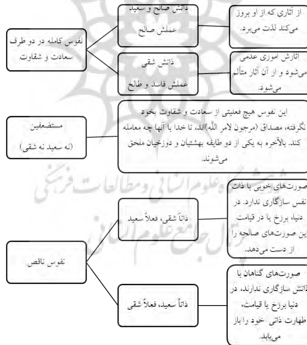
نمودار شماره ۴ نمودار مقایسه‌ای سعادت و شقاوت

صورت‌های نفسانی در این مرحله شکل گرفته و موجب تنوع نفوس انسانی می‌شوند. نفوس انسانی با حرکت جوهری دگرگون شده و به صورت مجرد خیالی درآمده و در آنجا متوقف می‌شوند و/یا با حرکت جوهری از مجرد خیالی عبور کرده و مجرد عقلی کلی گردیده و به مرحله صورت‌های عقلی می‌رسد. اگر صورت نفسانی انسان صورت سعادت باشد، در برزخ در راه سعادت قرار گرفته و اگر صورت شقاوت باشد، در راه شقاوت قرار می‌گیرد. بنابراین، نفس انسانی در عود و بازگشت، در همان مرتبه‌ای که ذاتش از آن تعیین یافته، مستقر می‌شود. به عبارت دیگر، انسان که حدوداً جسمانی و بقائاً روحانی است، تعیین نوع جسمانی او به هر صورتی که باشد، سعادت یا شقاوت و بازگشتش هم به همان صورت خواهد بود. بنابراین باطل بودن مجازات، بی‌تأثیری تربیت و اخلال در نظام تشریح، با این تبیین از سعادت و شقاوت منتفی می‌شود (طباطبائی، ۱۴۲۸ ق: ۱۰۳-۱۰۱). مجموع سخنان علامه در باب سعادت و شقاوت، رابطه اعمال با آنها و ترتب مجازات بر اعمال را به شرح نمودار ذیل می‌توان خلاصه نمود: