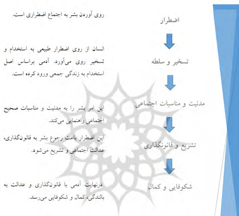
شکل شماره ۱ مراحل شکل‌گیری اعتباریات

علامه تصریح دارد که انسان‌ها از سر ناچاری است که به زندگی مدنی و جمعی روی می‌آورند. روی آوردن انسان به اجتماع، مدنیت، استخدام و قانون‌گذاری از روی اضطرار بوده و اگر اضطرار نبود، انسان هیچ‌گاه مایل نبود که اراده و آزادی خود را محدود یا واگذار کرده و به زندگی اجتماعی، قانون‌گذاری و عدالت اجتماعی اهتمام ورزد (طباطبایی، ۱۳۷۴، ج ۲: ۱۷۶).