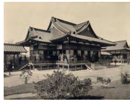
تصویر ۱. غرفه خانه ژاپنی پس از ساخت در نمایشگاه ۱۸۷۶، مأخذ: Jackson (2016). تصویر ۲. غرفه ژاپن در نمایشگاه جهانی ۱۸۸۹، مأخذ: Winter (2013). تصویر ۳. تالار اصلی ققنوس در نمایشگاه جهانی ۱۸۹۳، مأخذ: Meyers (2013).