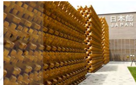
تصویر ۸. فضای داخلی غرفه ژاپن در نمایشگاه جهانی ۲۰۰۰، مأخذ: Ochsendorf (2005). تصویر ۹. نمای خارجی غرفه ستو در نمایشگاه جهانی ۲۰۰۵، مأخذ: Hikosaka (2005). تصویر ۱۰. جزئیات نمای غرفه ژاپن در نمایشگاه ۲۰۱۵، مأخذ: La Tegola et al. (2019).