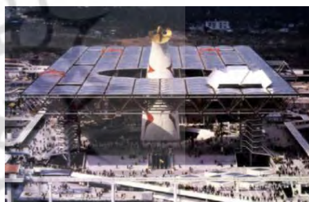
تصویر ۶. سالن‌های ساخته‌شده از تیرهای بتنی در غرفه ژاپن در نمایشگاه جهانی ۱۹۶۷. تصویر ۷. پلازای جشنواره در نمایشگاه جهانی ۱۹۷۰.