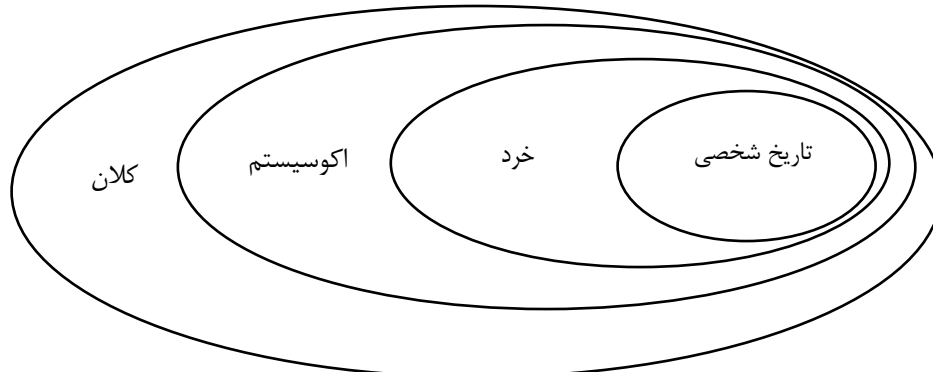
شکل ۱. عوامل مرتبط با خشونت علیه زنان در سطوح مختلف اکولوژی اجتماعی (منبع: Heise, 1998: 264)

در جمع‌بندی نهایی می‌توان گفت برخی از رویکردهای نظری فوق بر ویژگی‌های فردی خشونت‌ورزان و خشونت‌دیدگان تأکید کرده‌اند و برخی دیگر بر ویژگی‌های ساختاری جامعه. در این تحقیق برای ایجاد حساسیت نظری، از مفاهیم یادگیری خشونت از طریق نهادهای اجتماعی‌کننده مثل خانواده از دیدگاه فمینیستی، ایدئولوژی سلطه مرد، مفاهیم قدرت به و قدرت بر از نظریه روابط و قدرت، و نظریه نگرش‌های اغماض‌گر خشونت و پذیرش موقعیتی خشونت‌گزینش شده‌اند و در تحلیل یافته‌های تحقیق نقش‌آفرین بوده‌اند.