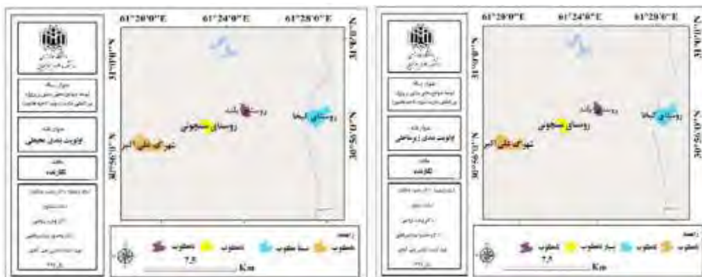
شکل ۶ و ۷. وضعیت روستاها و شهر علی اکبر بر اساس بُعد زیرساختی و محیطی