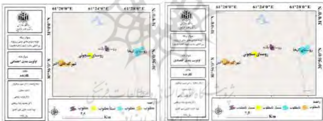
شکل ۴ و ۵. وضعیت روستاها و شهر علی اکبر بر اساس بُعد اجتماعی و اقتصادی