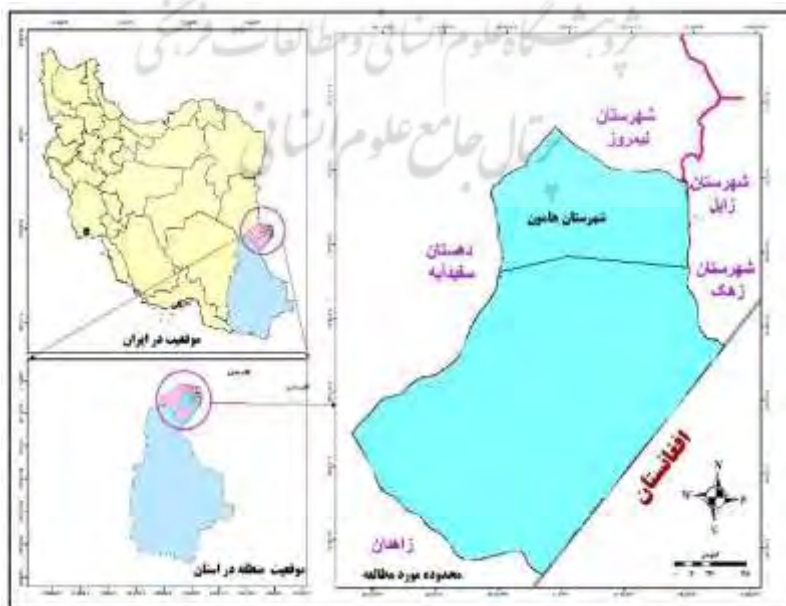
شکل ۲. موقعیت جغرافیایی شهرستان هامون و محدوده پایلوت منارید

شهرستان هامون در مختصات جغرافیایی ۶۰ درجه و ۹۶ دقیقه تا ۶۱ درجه دقیقه طول شرقی و ۹۰ درجه و ۰ دقیقه تا ۹۱ درجه عرض شمالی واقع شده است و از سمت شمال به شهرستان نیمروز، از سمت شرق به شهرستان زابل و زهک، از سمت جنوب شرق به کشور افغانستان و از سمت جنوب به شهرستان زاهدان محدود می‌شود (شکل ۲). شهرستان هامون حدود ۶۳۱۰ کیلومتر مربع وسعت دارد و دو شهر، دو بخش، شش دهستان و ۱۰۶ آبادی دارای سکنه دارد. محدوده مورد مطالعه پروژه منارید به وسعت ۲۰۰۷۰ هکتار، در دهستان محمدآباد از بخش شیب آب قرار دارد. این محدوده از شمال به رودخانه سیستان (نهراب)، از شرق به راه ارتباطی زابل-زاهدان، از جنوب به کانال سیمانی شماره یک شیب آب و از غرب به اراضی مرتعی دریاچه هامون هیرمند محدود می‌گردد و میانگین ارتفاع آن ۴۷۳ متر از سطح دریا است. این عرصه به صورت یک دلتا است که شیب خیلی کم به طرف هامون داشته و خاکش بسیار ریزدانه است. شهرستان هامون نیز دارای چهار دهستان (محمدآباد، لوتک، تیمورآباد، کوه خواجه) می‌باشد. پایلوت پروژه بین‌المللی منارید در سه روستا به نام‌های (کیخا، سنچولی، بلند) و شهر علی اکبر است (شکل ۲).