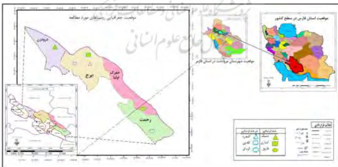
شکل ۲. جایگاه محدوده مورد مطالعه در تقسیمات کشوری

قلمرو این پژوهش شهرستان مرودشت است که در استان فارس واقع شده و با مساحت ۳۶۵۵۶ کیلومترمربع در طول شرقی حداقل ۱ دقیقه و ۵۲ درجه و حداکثر ۱۴ دقیقه و ۵۳ درجه و عرض شمالی حداقل ۴۱ دقیقه و ۲۹ درجه و حداکثر ۳۷ دقیقه و ۳۰ درجه قرار گرفته است و دارای ۵ شهر، ۵ بخش و ۱۵ دهستان و ۵۷۱ آبادی می‌باشد که حدوداً نیمی از آبادی‌های آن (تعداد ۲۷۱ آبادی) خالی از سکنه هستند. جمعیت این شهرستان ۳۲۳۴۳۴ نفر است که ۵۱/۵ درصد ساکن شهر (تعداد ۱۶۶۷۱۵ نفر)، ۴۸/۴ درصد ساکن روستا (تعداد ۴۸/۴ نفر) و ۰/۱ درصد غیرساکن (تعداد ۳۰۱ نفر) هستند (مرکز آمار ایران، ۱۳۹۵).