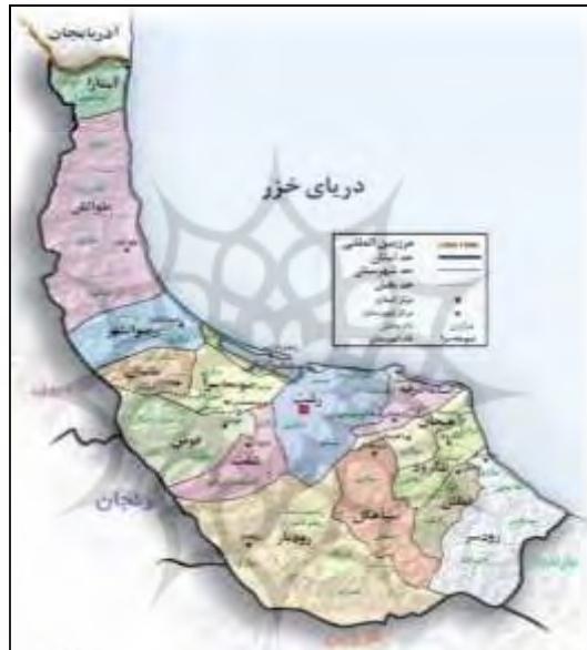
شکل ۲. موقعیت جغرافیایی شهر پره سر

شهر پره سر یکی از شهرهای استان گیلان در شمال ایران است. پره سر در کناره جنوب غربی دریای خزر بین شهر انزلی و هشتمین در شهرستان رضوانشهر یا کریدور شمال-جنوب قرار دارد. پره سر در ۱۳۴۱ خورشیدی شهر شد و با تشکیل بخش پره سر در سال ۱۳۷۶ خورشیدی، به مرکزیت آن درآمد. جمعیت آن طبق سرشماری اولیه ۱۳۹۰ خورشیدی، ۷۸۲۶ تن بوده است. نام این شهر از دو قسمت (پره=محل ماهیگیری) و (سر=پسوند مکان) تشکیل شده است. شهر پره سر، در مغرب و شمال شهرستان رضوانشهر قرار دارد. از شمال به بخش آسالم (در شهرستان طوالش)، از جنوب به بخش مرکزی (شهرستان رضوانشهر) و شهرستان ماسال، از مشرق به دریای خزر و از مغرب به شهرستان خلخال محدود می‌شود و مشتمل است بر دو دهستان به نام‌های دیناچال و بیلاقی آرده و شهر پره سر. از مهمترین مناطق گردشگری پره سر آبشار ویسار است که یکی از مکان‌های دیدنی و البته ناشناخته ایران می‌باشد. به گفته اهالی منطقه توسط خود گردشگران کشف و معرفی شده است. آبشار در منطقه کوهستانی پره سر گیلان و در انتهای جاده‌ای باریک و سرسبز قرار دارد. از سایر مکان‌های دیدنی می‌توان به سلطان برزکوه، بیلاقات پره سر، پارک جنگلی دکتر درستکار، سواحل دریا، بقعه سلطان برزکوه، مقبره سید نجم‌الدین اشاره کرد.