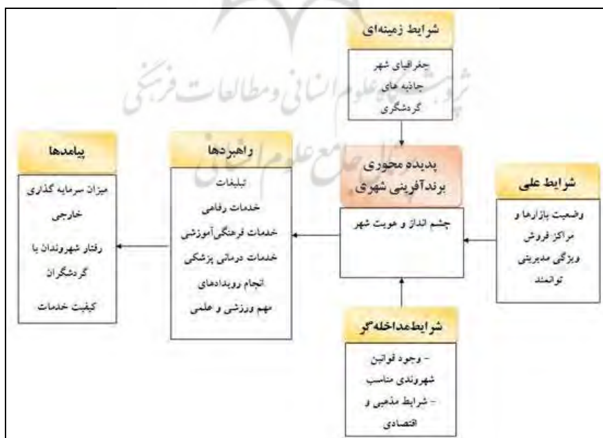
شکل ۱. مدل مفهومی تحقیق

با توجه به الگوی پارادایمی ارائه‌شده، مدل (شکل ۱) و فرضیه‌های تحقیق به‌صورت زیر ارائه می‌گردد: