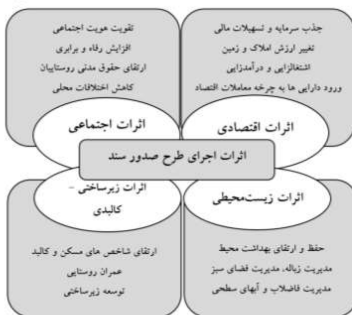
شکل ۱. اثرات و اهداف طرح صدور سند

از سویی براساس تعاریف و مطالعات بسیار صورت گرفته در این راستا، زیست‌پذیری منعکس‌کننده رفاه یک اجتماع محلی است و مشتمل بر بسیاری از خصوصیتی است که یک مکان را تبدیل به جایی می‌کند که مردم تمایل به زندگی در آن‌جا در زمان حال و آینده دارند (Victorian Competition & Efficiency Commission, 2008).