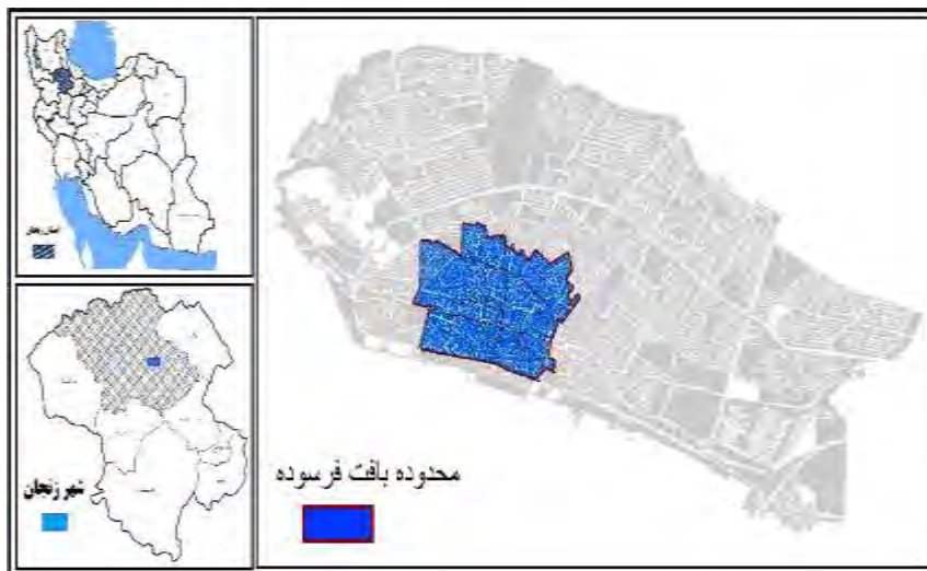
شکل ۱. موقعیت جغرافیایی محدوده مورد مطالعه