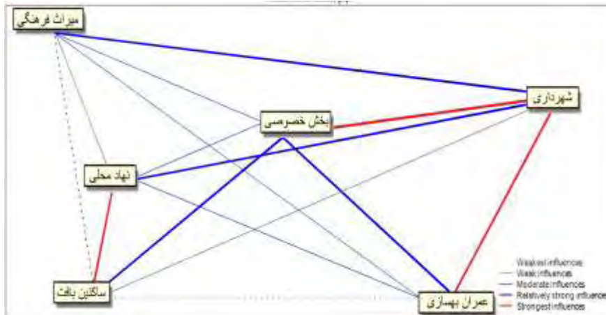
شکل ۴. نحوه همگرایی بین کنشگران اعیان سازی بافت فرسوده در شهر زنجان