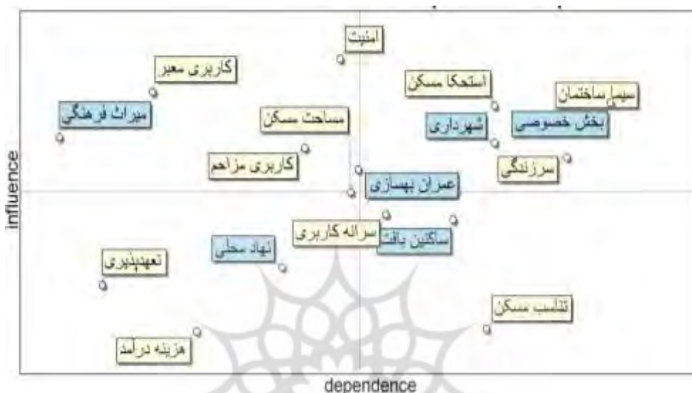
شکل ۳. نقشه روابط بین بازیگران و اهداف

عمران و بهسازی و پیشران ها نیز شامل استحکام مسکن، وضعیت کاربری معابر، کاربری های ناسازگار و مزاحم، امنیت می باشد. بخش سوم نیز شامل بازیگران مستقل مانند نهادهای محلی (مانند شورای محله و سرای محله و دفاتر تسهیلاتگری) و پیشران های تعهد پذیری و تناسب هزینه و درآمد است و در نهایت بخش چهارم نیز شامل بازیگران مغلوب مانند ساکنین بافت فرسوده و پیشران های تناسب مسکن با نیاز ساکنین، و سرانه کاربری خدماتی می باشد. بازیگران و پیشران های این بخش، تحت تاثیر مولفه ها و بازیگران دیگر بویژه شهرداری و بخش خصوصی (شرکت های بساز بفروش و واسطه های سرمایه گذاری و فروش زمین و مسکن)، نتوانسته اند تاثیر قابل توجهی در اعیان سازی و جراحی کالبدی و هویتی بافت قدیم و فرسوده شهری داشته باشند و بیشتر تابع برنامه ریزی متمرکز و دولتی شهر و حتی استان بوده اند.