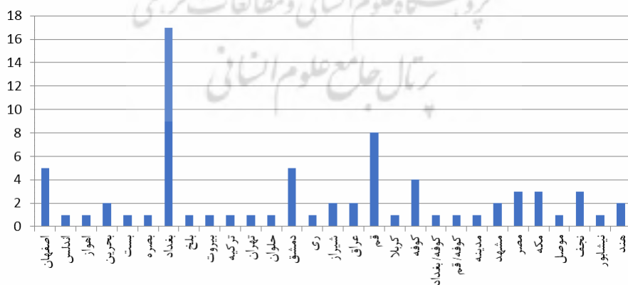
نمودار ۲. مکان تألیف آثار