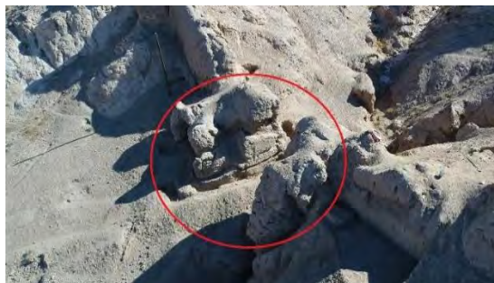
تصویر ۷: دروازه ورودی حصار دوم قلعه اردشیر (ریاحیان، ۱۳۹۸)

بخش حاکم‌نشین در سمت جنوب و در بالاترین قسمت قلعه قرار دارد (تصویر ۸). موقعیت بی‌نظیر و جانمایی هوشمندانه این قسمت و تسلط کافی بر محدوده اطراف قلعه دارای اهمیت بسیاری است. بیشترین آثار قلعه در این قسمت وجود دارد که بخشی از آن به علت نصب دکل مخابرات آسیب دیده است. برج‌های دیده‌بانی در سمت جنوب غربی آن ساخته شده و مصالح همگی آنها سنگ است. راه نفوذ دشمنان به این بخش، با توجه به پرتگاه بسیار عمیق در پشت آن و حصار بلند تا ارتفاع ۲۰ متر عملاً مسدود بوده است.