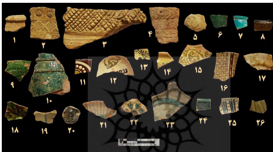
تصویر ۱۱. نمونه سفال‌های شناسایی شده در قلعه اردشیر (نگارنده اول، ۱۴۰۱)