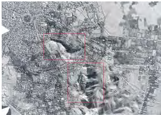
تصویر ۱: عکس هوایی قلعه دختر (قسمت بالا) و قلعه اردشیر (قسمت پایین) در شهر کرمان (سازمان نقشه‌برداری کشور، ۱۳۳۵)

سطح دریا ۱۷۶۵ متر است. بلندترین نقطه قلعه‌دختر نسبت به سطح زمین‌های اطراف، ۶۰ متر اختلاف ارتفاع دارد. مساحت کلی قلعه‌دختر حدود ۱۰ هکتار است (تصویر ۱). قلعه اردشیر نیز در انتهای شرقی محدوده بافت تاریخی شهر کرمان، در فاصله ۵۰۰ متری در جنوب شرقی قلعه دختر، بر بلندای صخره‌ای کوه مانند قرار گرفته‌است. طول جغرافیایی آن ۵۷^{\circ} ۰۶' ۱۵'' ، عرض جغرافیایی آن ۳۰^{\circ} ۱۷' ۱۴'' و ارتفاع آن از سطح دریا به طور میانگین ۱۸۷۰ متر است. بلندترین نقطه قلعه اردشیر با پست‌ترین نقطه آن ۱۲۰ متر اختلاف ارتفاع دارد. مساحت کلی قلعه اردشیر حدود ۱۰ هکتار است (تصویر ۱).