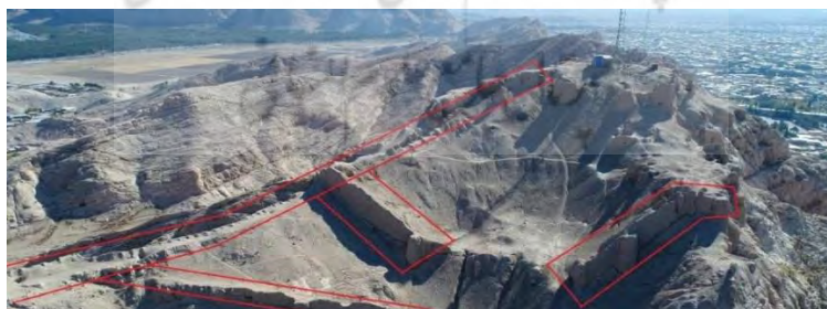
تصویر ۶: حصارهای باقی مانده از قلعه اردشیر (ریاحیان، ۱۳۹۸)

در قلعه اردشیر برای محافظت از قلعه، چهار حصار ایجاد شده که امروزه سه ردیف از آن‌ها سالم باقی مانده‌است (تصویر ۶). از حصار اول دیواره کمی باقی مانده‌است. در بین حصار اول و دوم تعدادی فضای مسکونی ساخته شده که باعث از بین رفتن بخش زیادی از حصار اول شده‌است. بیشترین آثار باقی مانده از حصارها در سمت جنوب غربی تا جنوب شرقی قلعه قرار دارد که در برخی بخش‌ها، ارتفاع حصار به ویژه در جبهه جنوب غربی بیش از ۲۰ متر است. حداثی حصارهای این قلعه برج‌هایی با پلان گرد و چهارگوش برای دیده‌بانی و محافظت از قلعه تعبیه شده‌است. همچنین در میان حصارها تعدادی مزغل برای تیراندازی وجود دارد. به دلیل عوارض طبیعی، مسیر دسترسی به قلعه اردشیر از جبهه شمالی در سمت پایین قلعه است و دروازه ورودی در حصار دوم قرار دارد (تصویر ۷). سازندگان قلعه برای جلوگیری از حملات دشمنان و افزایش امنیت آن، مسیر کوچکی را برای ورودی قلعه طراحی کرده و باروهایی در این مسیر ساخته‌اند.