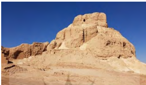
تصویر ۴: تختگاه آقامحمدخان یا برج توپر دیده‌بانی

روزنه‌های دیده‌بانی نیز وجود دارد. به نظر می‌رسد راه ارتباطی این سازه با بخش‌های دیگر، از طریق باروی قلعه‌دختر بوده‌است.