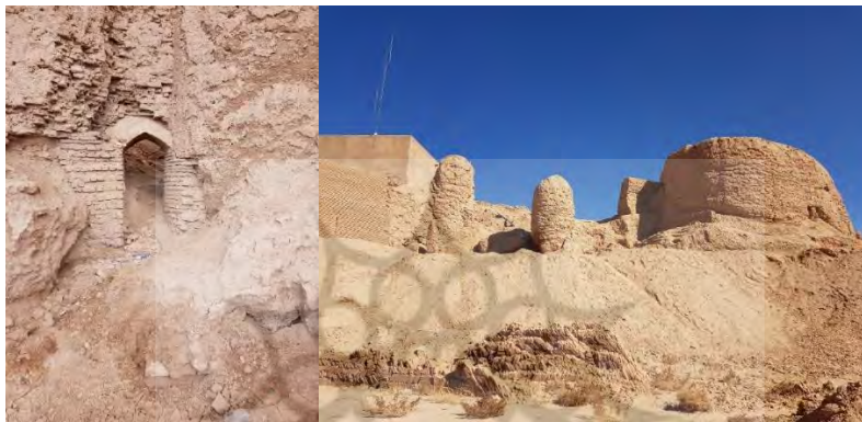
تصویر ۳: راست: دروازه سواره‌رو، چپ: دروازه پیاده‌رو و برج در شمال غربی بخش میانی

نظر می‌رسد این برج توپر به عنوان پشت‌بند برای استحکام بارو ایجاد شده‌است. اما احتمالاً این برج در زمان استفاده از قلعه دختر، ارتفاع بیشتری داشته و بخش فوقانی آن توخالی و محل دیده‌بانی بوده‌است و در دوره‌های بعد به صورت عمدی با خشت پر شده‌است. در جنوب بخش میانی قلعه دختر، بقایایی از حوضچه آب آجری با اندود ساروج و دو ردیف تنبوشه به قطر چهار سانتی‌متر وجود دارد.