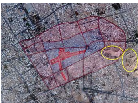
تصویر ۱۲: بخش مرکزی و حاشیه‌ای بافت کهن کرمان و قرارگیری قلعه دختر درون حاشیه بافت کهن و قلعه اردشیر در خارج از بافت کهن (غضنفرپور و علمیرادی، ۱۳۹۱: ۱۸۵)

اینکه قلعه دختر داخل بافت تاریخی شهر کرمان قرار داشته، دروازه‌های شهر کرمان نیز می‌بایست در نزدیکی قلعه دختر قرار داشته باشند، نه در نزدیکی قلعه اردشیر که در خارج از بافت تاریخی قرار دارد (تصویر ۱۲). بنابراین، با توجه به گفته‌های افضل‌الدین و خبیصی، قلعه کهنه را می‌توان همان قلعه دختر به حساب آورد.