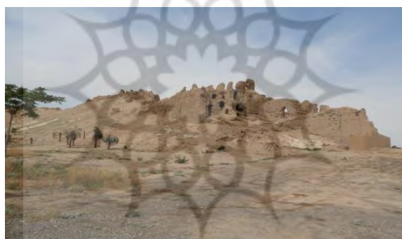
تصویر ۲: ساختارهای بخش شرقی قلعه دختر (نگارنده اول، ۱۳۹۹)

در انتهای شمالی بخش شرقی، قسمت‌هایی از یک بارو و ورودی و در انتهای شرقی محوطه، باروی دیگری بر جای مانده است. در انتهای جنوبی بخش شرقی نیز برج دفاعی با تیرکش‌ها و روزنه‌های دیده‌بانی ساخته شده است. همچنین، در بخش شرقی مجموعه، آثار معماری دو و سه طبقه برجای مانده است (تصویر ۲). به نظر می‌رسد این بناها در چند دوره ساخته و بازسازی شده‌اند. چنان‌که بخشی از قوس‌ها از نوع مازهدار و برخی دیگر از نوع تیزهدار هستند. قوس‌های مازهدار در این بخش شبیه قوس‌های قلعه دختر بم (ساسانی - صدراسلامی) هستند (برای مقایسه بنگرید به Anisi, 2012: 197).