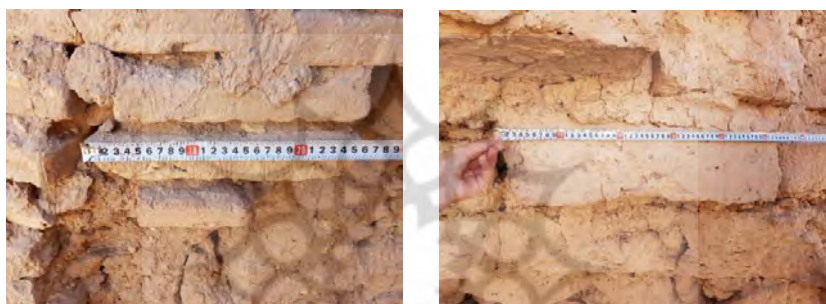
تصویر ۹. راست: خشت ۵۴ \times ۱۷ سانتی‌متر و چپ: آجر ۲۶ \times ۵ سانتی‌متری در قلعه اردشیر (نگارندگان، ۱۴۰۰)

مختلف است. بر پایه بررسی‌های میدانی نگارنده اول در قلعه اردشیر، خشت‌هایی با ابعاد متنوع در نقاط مختلف قلعه اردشیر به کار رفته است. کوچک‌ترین خشت‌های قلعه اردشیر کرمان ۲۱ \times ۲۱ \times ۶ سانتی‌متر و بزرگ‌ترین آن‌ها ۵۴ \times ۵۴ \times ۱۷ سانتی‌متر است (تصویر ۵). در قلعه اردشیر نیز همانند قلعه دختر، خشت‌هایی با ابعاد بزرگ‌تر از ۴۰ سانتی‌متر عمدتاً به دوران پیش از اسلام تعلق دارند، زیرا چنین ابعادی در خشت‌های دوران اسلامی رایج نبود. افزون بر خشت از آجر نیز در ساخت بناها استفاده شده است. آجرهایی در اضلاع ۲۳ \times ۲۳ \times ۴ و ۳۰ \times ۳۰ \times ۶ سانتی‌متر در قسمت‌های مختلف قلعه اردشیر دیده می‌شود.