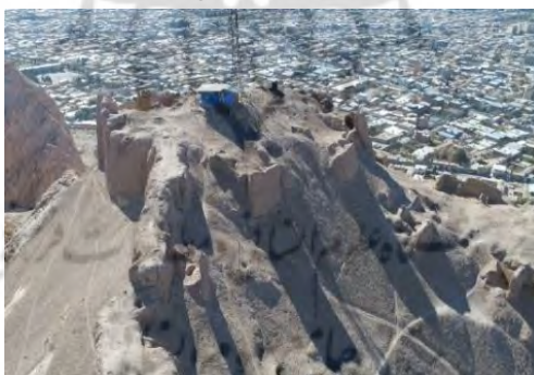
تصویر ۸: عکس هوایی بخش حاکم‌نشین قلعه اردشیر (ریاحیان، ۱۳۹۶)

بخش حاکم‌نشین در سمت جنوب و در بالاترین قسمت قلعه قرار دارد (تصویر ۸). موقعیت بی‌نظیر و جانمایی هوشمندانه این قسمت و تسلط کافی بر محدوده اطراف قلعه دارای اهمیت بسیاری است. بیشترین آثار قلعه در این قسمت وجود دارد که بخشی از آن به علت نصب دکل مخابرات آسیب دیده است. برج‌های دیده‌بانی در سمت جنوب غربی آن ساخته شده و مصالح همگی آنها سنگ است. راه نفوذ دشمنان به این بخش، با توجه به پرتگاه بسیار عمیق در پشت آن و حصار بلند تا ارتفاع ۲۰ متر عملاً مسدود بوده است.