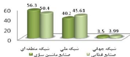
شکل ۴) مقایسه شدت روابط با سطوح مختلف شبکه ها

شبکه بندی و تعامل بنگاه ها با عناصر مختلف منطقه ای است که به ارتقاء یادگیری تعاملی و نوآوری بنگاه ها منجر می شود. در نتیجه بنگاه ها برای یادگیری و نوآوری علاوه بر منابع درونی بنگاه، نیازمند تعامل و روابط رسمی و غیررسمی با بازیگران مختلف منطقه ای هستند [۱۲، ۱۴ و ۲۵]. بر همین مبنا در این بخش به توصیف میزان روابط با انواع شبکه های تاثیرگذار بر روی بنگاه ها، سطوح جغرافیایی این شبکه ها، اهمیت و تاثیر آنها در نوآوری بنگاه ها و شدت ارتباط بنگاه ها با این موسسه ها پرداخته شده است. طبق شکل ۴ ملاحظه می شود که در هر دو صنعت مورد مطالعه، بنگاه ها به ترتیب با شبکه های منطقه ای، ملی و جهانی ارتباط بیشتری دارند. اما در صنایع ماشین سازی، شبکه منطقه ای قوی تر بوده و در صنایع غذایی و آشامیدنی، شبکه ملی قوی تر می باشد. اما شدت روابط با شبکه های جهانی در هر دو صنعت با درصد های ۳/۵ و ۳/۹۹ بسیار ضعیف می باشد.