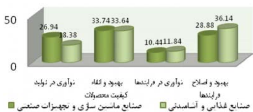
شکل ۳) درصد فراوانی نوآوری‌ها در دو صنعت مورد مطالعه

چند متغیر که هر کدام نشان‌دهنده نوعی از نوآوری هستند؛ حاصل می‌شود. این متغیرها عبارتند از نوآوری در تولید، بهبود و ارتقاء کیفیت تولیدات، نوآوری در فرایند، بهبود و اصلاح فرایندهای موجود. در نتیجه به‌منظور تحلیل داده از شاخص ترکیبی نوآوری استفاده شده است که مراد از آن، جمع تعداد نوآوری‌های ایجاد شده در بنگاه‌ها در تولید و در فرایند تولید در طی سه سال اخیر (۱۳۸۵ تا ۱۳۸۸) می‌باشد (با توجه به اینکه داده‌ها دارای پایایی درونی هستند و در واقع داده‌های جمع‌آوری شده از یک جنس می‌باشند پس می‌توان از شاخص ترکیبی نوآوری به‌صورت جمع تعداد انواع نوآوری استفاده کرد). بر اساس شکل ۳ ملاحظه می‌شود که نوآوری در تولید و بهبود کیفیت تولیدات بنگاه‌های مربوط به صنایع ماشین‌سازی و تجهیزات صنعتی (به ترتیب با ۲۶/۹۴ و ۳۳/۷۳) نسبت به صنایع غذایی و آشامیدنی (با ۱۸/۳۸ و ۳۳/۶۴) بیشتر است در حالیکه متغیرهای مربوط به نوآوری در فرایندها و بهبود و اصلاح فرایندهای موجود در بنگاه‌های صنایع غذایی و آشامیدنی (به ترتیب با ۱۱/۸۳ و ۳۶/۱۳) نسبت به صنایع ماشین‌سازی و تجهیزات صنعتی (با ۱۰/۴۳ و ۲۸/۸۸) نوآورتر هستند. به‌طورکلی ظرفیت‌های نوآوری در صنایع ماشین‌سازی و تجهیزات صنعتی در منطقه کلان‌شهری تبریز (۴۷۳) از ظرفیت‌های نوآوری صنایع غذایی و آشامیدنی در همین منطقه (۳۸۴) بیشتر می‌باشد.