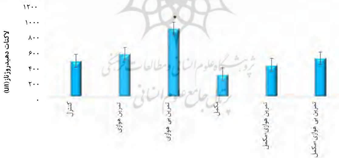
شکل ۲. مقایسه میانگین و انحراف معیار سطح پلاسمایی LDH در گروه های مورد مطالعه. * تفاوت معنی دار با گروه کنترل در سطح p < 0.05 .