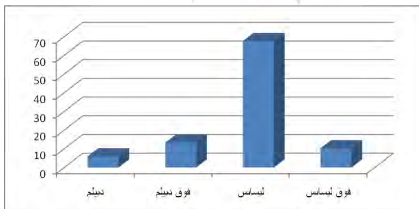
نمودار شماره 2: توزیع پاسخگویان بر حسب وضعیت تحصیلی

در تحقیق حاضر میزان تحصیلات افراد در سطح رتبه‌ای سنجیده شده است. میانگین و مد سطح تحصیلات؛ لیسانس، کمترین آن؛ دیپلم و بیشترین آن فوق لیسانس است. نمودار زیر توزیع سطح تحصیلات پاسخگویان را نشان می‌دهد.