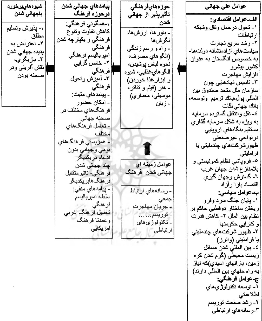
شکل ۱- مدل جامع جهانی شدن