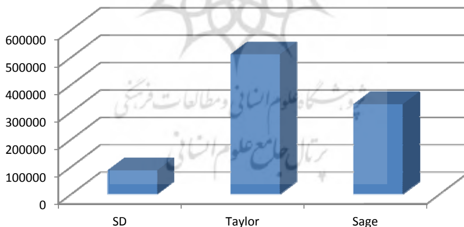
نمودار ۲. میزان هزینه- سودمندی در پایگاه‌های مختلف

طبق تعریف هزینه- سودمندی هر چه نمره هزینه/میزان استفاده کوچکتر باشد، حاکی از سودمندی بالاتری می‌باشد. همان‌طور که در جدول ۷، مشاهده می‌شود هزینه- سودمندی پایگاه ساینس دایرکت از همه بالاتر است. یعنی در مقایسه با