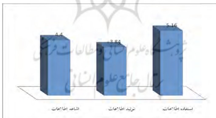
نمودار ۲- وضعیت کلی جریان اطلاعات در پژوهشکده‌های دانشگاه آزاد اسلامی

۴. در پژوهشکده‌های مورد مطالعه درونداد اطلاعات با میانگین ۵/۱۶ (۵۷/۳۳ درصد) بیشتر از پردازش اطلاعات با میانگین ۳/۸۴ (۴۲/۶۶ درصد) و برون‌داد اطلاعات با میانگین ۴/۲۰ (۴۸/۸۸ درصد) است. هم‌چنین برون‌داد اطلاعات تا حدودی مطلوب‌تر از پردازش اطلاعات است. نتایج به طور وضوح در نمودار ۲ نمایش داده شده است.