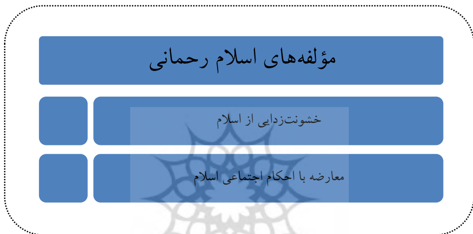
شکل ۲: مؤلفه‌های اسلام رحمانی

دانستن متون دینی و کمک گرفتن از پیش‌فرض‌ها برای تفسیر متن است، زیرا متن مانند طبیعت امر مبهمی است که چندین معنا در بر دارد، زیرا معنای واقعی وجود ندارد و معناهای درست متعدّد می‌توان داشت. بنابراین، پلورالسیم معرفتی که رکن اساسی اسلام رحمانی است. حق بودن دین واحد را مردود دانسته به حق‌های متعدّد باور دارد و به توجیه تعارض ادیان می‌پردازد (همان، صص ۳۴۸-۳۵۴) ایا امر به نسبت معرفتی می‌انجامد و انسان را در گردابی مبهم غرق می‌سازد.