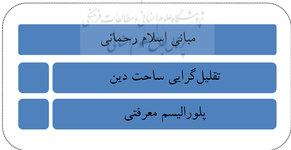
شکل ۳: مبانی اسلام رحمانی