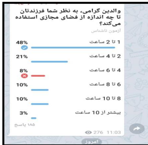
شکل ۲. نظرسنجی از والدین دانش آموزان پایه ششم در مورد اندازه استفاده دانش آموزان از فضای مجازی

نتایج نظرسنجی در بستر برنامه شاد در مورد میزان استفاده دانش آموزان از فضای مجازی نشان می دهد که متأسفانه ۵۲ درصد دانش آموزان بیشتر از میانگین استاندارد برای دانش آموزان (استاندارد استفاده از اینترنت برای دانش آموزان طبق تحقیقات معتبر بین ۱ تا ۲ ساعت آن هم با نظارت والدین است) از اینترنت استفاده می کنند. محاسبه میانگین استفاده دانش آموزان هاجر از فضای مجازی نشان می دهد که به طور میانگین دانش آموزان این آموزشگاه ۶ ساعت از اینترنت استفاده می کنند و اعتیاد به اینترنت در بیشتر آن ها مشاهده می شود.