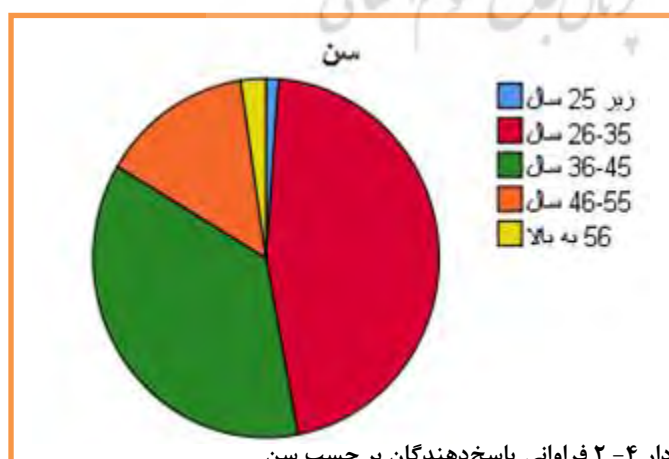
نمودار ۴-۲ فراوانی پاسخ دهندگان بر حسب سن