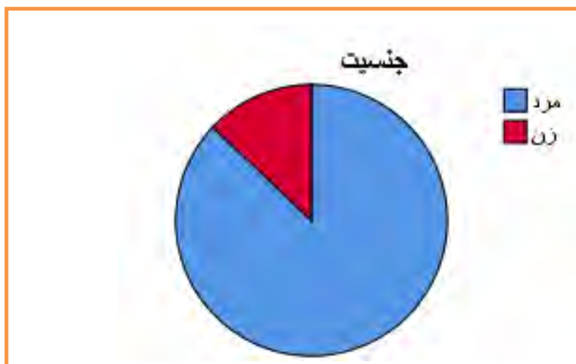
نمودار ۴-۱ فراوانی پاسخ دهندگان بر حسب جنسیت