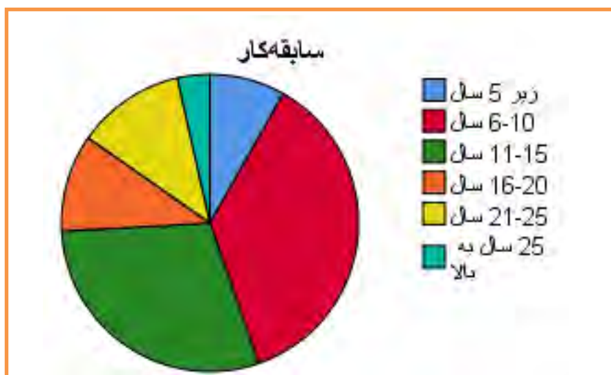
نمودار ۴-۴ فراوانی پاسخ دهندگان بر حسب سابقه کار