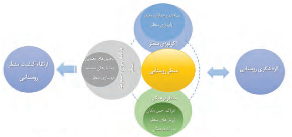
شکل ۴. رابطه مفاهیم اصلی منظر روستایی و گردشگری روستایی در تحقق ارتقاء کیفی منظر