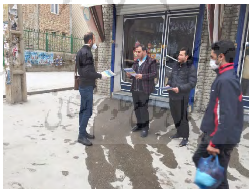
تصویر شماره ۴: ترغیب ساکنان برای مشارکت در پاکیزگی و تمیز نگه داشتن محله خود