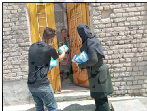
تصویر شماره ۳: توزیع ماسک رایگان توسط اعضای سمن ها در میان ساکنان سکونتگاه های غیررسمی

و بیمه»، «شناسایی و اولویت بندی نیازمندان» و «تشویق جامعه و طبقه ثروتمند و خیر برای کمک به اقشار ضعیف» بوده است. گویه های «رایزنی با بانک ها و مؤسسات مالی و اعتباری برای جلب نمودن توجه آنها برای توجه به اقشار آسیب پذیر»، «تأمین و در اختیار گذاشتن ابزار و تجهیزات تولیدی» و «مشارکت در امور اقتصادی درآمدزا برای کمک به نیازمندان» در رتبه های آخر اولویت بندی یعنی ۷، ۶ و ۸ قرار گرفته اند که نشان از فعالیت بسیار پایین سازمان های مردم نهاد در این شاخص هاست (جدول شماره ۷).