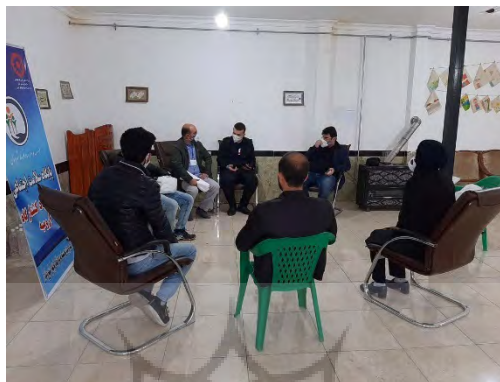
تصویر شماره ۲: برگزاری جلسات میان اعضای سمن ها به منظور برنامه ریزی برای ارتقای مشارکت پذیری و افزایش سطح آگاهی و دانش شهروندان

نقش سازمان های مردم نهاد در مؤلفه اجتماعی-فرهنگی با استفاده از پنج شاخص و شش گویه مورد بررسی قرار گرفته است. براساس محاسبات توصیفی انجام شده (جدول شماره ۴) بالاترین میانگین حاصله مربوط به شاخص «ارائه آموزش مهارت های مقابله ای در برابر کرونا» با میانگین ۴/۴۷ (نزدیک به عدد ۵؛ خیلی زیاد در طیف لیکرت) است که حاکی از فعالیت بالای سازمان های مردم نهاد شهر ارومیه در این شاخص است. پس از آن شاخص های «ارتقای مشارکت پذیری»