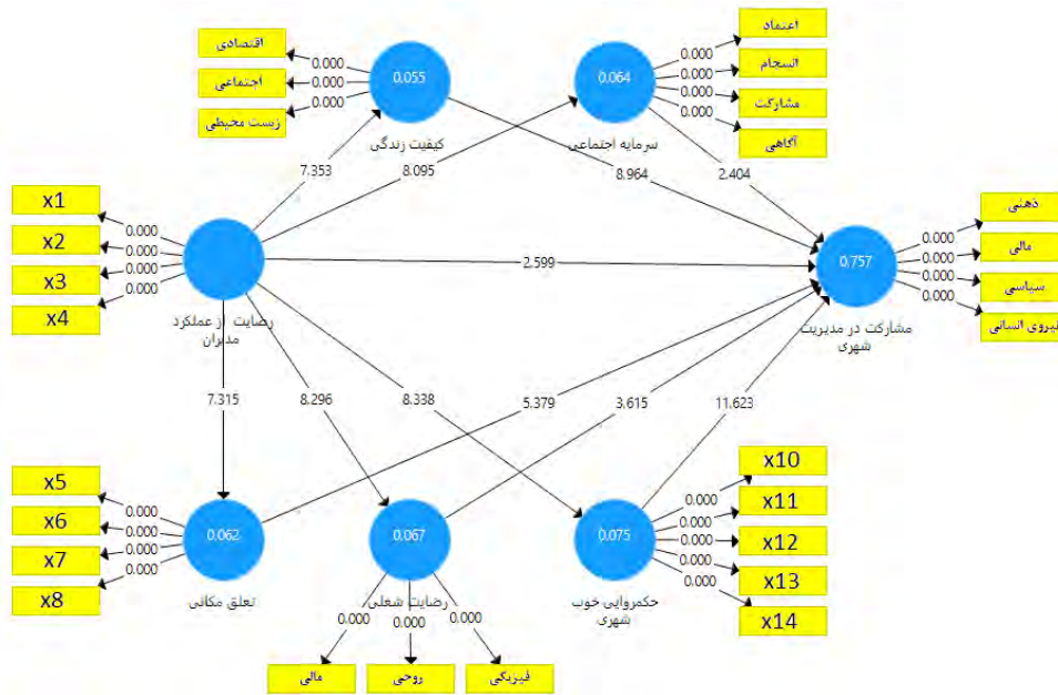
تصویر شماره ۱: مدل ساختاری تحقیق همراه با مقادیر t-values و سطح معنی داری سازه‌های اصلی