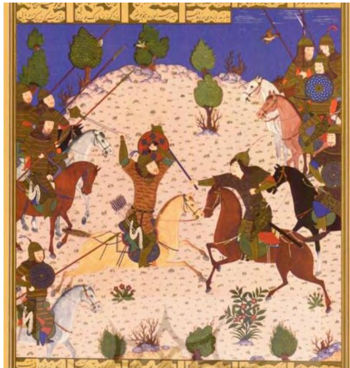
تصویر ۲: رستم و سهراب، شاهنامه بایسنقری، هرات، ۸۲۳ ه.ق، کتابخانه کاخ گلستان، تهران.

در حماسه ایلپاد نیز نمونه‌هایی از آن وجود دارد: «همان دم از گردونه‌های خود جستند، دست یک‌دیگر را فشردند و سوگند جاودانی یاد کردند» (هومر، ۱۳۸۶: ۱۶۰). آگامنون دست منلاس را گرفت و گفت: «برادر گرامی، چون تو را به خطر انداختم که به تنهایی در راه مردم آخایی با مردم تروا نبرد کنی در این پیمان مرگ تو را خواستار شدم، ایشان تو را زخم زدند و پیوند اتحاد ما را زیر پا گذاشتند اما سوگندهای ما، خون‌بره‌ها و نذر کردن باده‌های ناب و این دست یگانگی که با ما دادند و ما آن را درست پنداشتیم، بیهوده نخواهد بود» (همان: ۱۰۹).