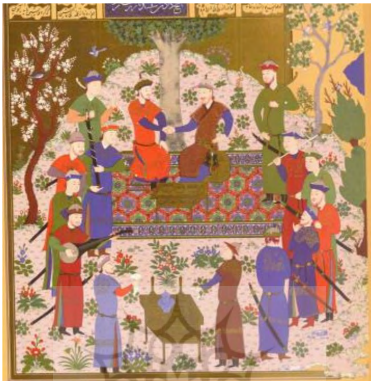
تصویر ۱: دست دادن رستم و سفندیار، شاهنامه بیسنقری، هرات، ۸۳۳ ه.ق. کتابخانه کاخ گلستان، تهران.

ورمازرن هم فشردن دست راست را دلیل مهرپرستی می‌داند: «اما دلیل این که مهرپرستی در آسیای صغیر ظاهر شده، کتیبه معروفی است در نمرود داغ (۶۹ - ۳۸ پ. م) که در آن نام‌های آپولون، میترا، هلیوس و هرمس ذکر شده است؛ مقصود از این چهار نام یکی است، یعنی آپولون همان میترا و هرمس است زیرا این نام‌ها برای تصویر خدایی است که دست راست پادشاه را به‌عنوان حامی و متحد می‌فشارد» (ورمازرن، ۱۳۸۳: ۶). در شاهنامه فردوسی حین انعقاد پیمان این آیین مراعات می‌شود، به‌عنوان نمونه، سیندخت برای بیان حقیقت جریان آشنایی زال و رودابه از سام تقاضا می‌کند که در ابتدا با او پیمانی منعقد کند: