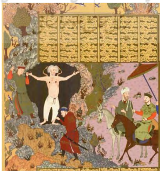
تصویر ۴. دربند کردن ضحاک توسط فریدون در کوه دماند، شاهنامه بایسنقری، هرات، ۸۳۳.ه.ق، کتابخانه کاخ گلستان، تهران.

در ایلید، خدایان گواه پیمان هستند: «آگاممنون دست به آسمان برافراشت و به بانگ بلند دعا خواند: ای زئوس ای پدر والا جا، ای خدای بزرگ و کینه‌کش، ای آفتابی که همه چیز را می‌شنوی و هیچ چیز از دیدگانت پوشیده نیست و پیمان‌شکنان گنه‌گار را کیفر می‌دهید، گواه ما باشید و استواری سوگندهای ما را پاس دارید» (هومر، ۱۳۸۶: ۹۷). در شاهنامه حتی ضحاک نیز در تفکرش پیمان را محترم می‌داند. او پس از آنکه بر تخت شاهی نشست با ابلیس پیمان بست و از دستورات او اطاعت می‌کرد. تصویر شماره (۴) بخشی از سرنوشت ضحاک را به تصویر کشیده است.