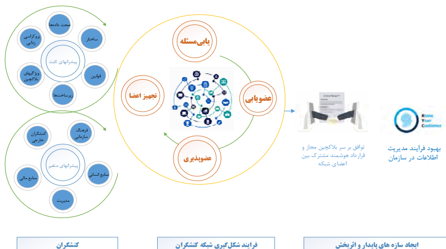
شکل ۲. مدل مفهومی پذیرش بلاکچین به کمک نظریه کنشگر- شبکه در جهت تسهیل مدیریت اطلاعات (رستمی‌مازویی ۱۳۹۸)

در سیستم سنتی و جاری «سازمان تأمین اجتماعی» شاهد حجم گسترده‌ای از کاغذبازی درون‌سازمانی و برون‌سازمانی هستیم. با توجه به وابستگی اغلب روندهای سازمانی به استعلامات بین‌سازمانی، روند رفت‌و برگشتی نام‌نگاری‌ها که اغلب برای تسریع نسبی به‌وسیله ارباب رجوع انجام می‌شود، به دلیل وقفه در پاسخگویی موجب اتلاف زمان، خستگی و سردرگمی مراجعه‌کنندگان و کارشناسان «سازمان» می‌شود. اگرچه «سازمان» در آخرین تحولات خود تحت عنوان طرح ۳۰۷۰ گام‌های مهمی در راستای غیرحضوری کردن خدمات برداشته است و این نشانگر تمایل «سازمان» به تکریم ارباب رجوع و افزایش رضایتمندی از خدمات «سازمان» است، اما فرایند اخذ استعلامات، احراز هویت، و بسیاری از فرایندها، همچنان نیاز به زمان و مراجعات حضوری دارد. با ایجاد شبکه بلاکچینی مد نظر این پژوهش، تمامی سازمان‌های روی بلاکچین می‌توانند اجازه بهره‌برداری از اطلاعات را محدود کنند و اطلاعات محرمانه درون‌سازمانی خود را به شبکه بلاکچین خصوصی خود مختص نمایند و اطلاعات لازم برای پیشبرد اهداف بین‌سازمانی را در بلاکچین مجاز در اختیار سایر سازمان‌ها قرار دهند. با تشکیل شبکه بلاکچینی متشکل از سازمان‌های دولتی و غیردولتی، بسیاری از روندها در آن واحد انجام شده و نیاز به استعلام و نام‌نگاری کاغذی نخواهد بود. مثال‌های زیر تنها بخشی از مزایای استفاده از شبکه بلاکچینی بین